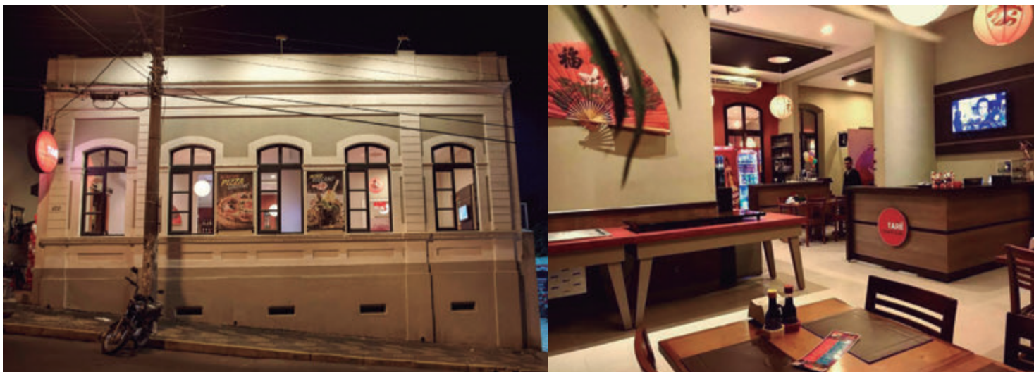
O Tarê Pizza & Sushi está localizado na rua Bento Dias, 173, no Centro de Capivari, com amplo espaço e tematização japonesa

Não é fácil manter uma alimentação saudável e equilibrada diante de tantas tentações que existem no cardápio, no entanto, não é uma missão impossível, o ideal é consumir os alimentos crus, cozidos ou assados; moderação nos pratos que contenham arroz, pois eles normalmente contém açúcar na sua preparação; e, evitar os pratos que são fritos.