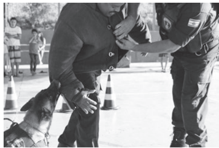
Uni, a cadela da Guarda Municipal de Capivari mostrando seus dotes

Para a diretora a palestra foi enriquecedora e despertou o respeito pela GCM. “No geral, foi muito engrandecedor ao nosso projeto e, certamente uma sementinha foi lançada no solo fértil que é o coração de nossas crianças”.