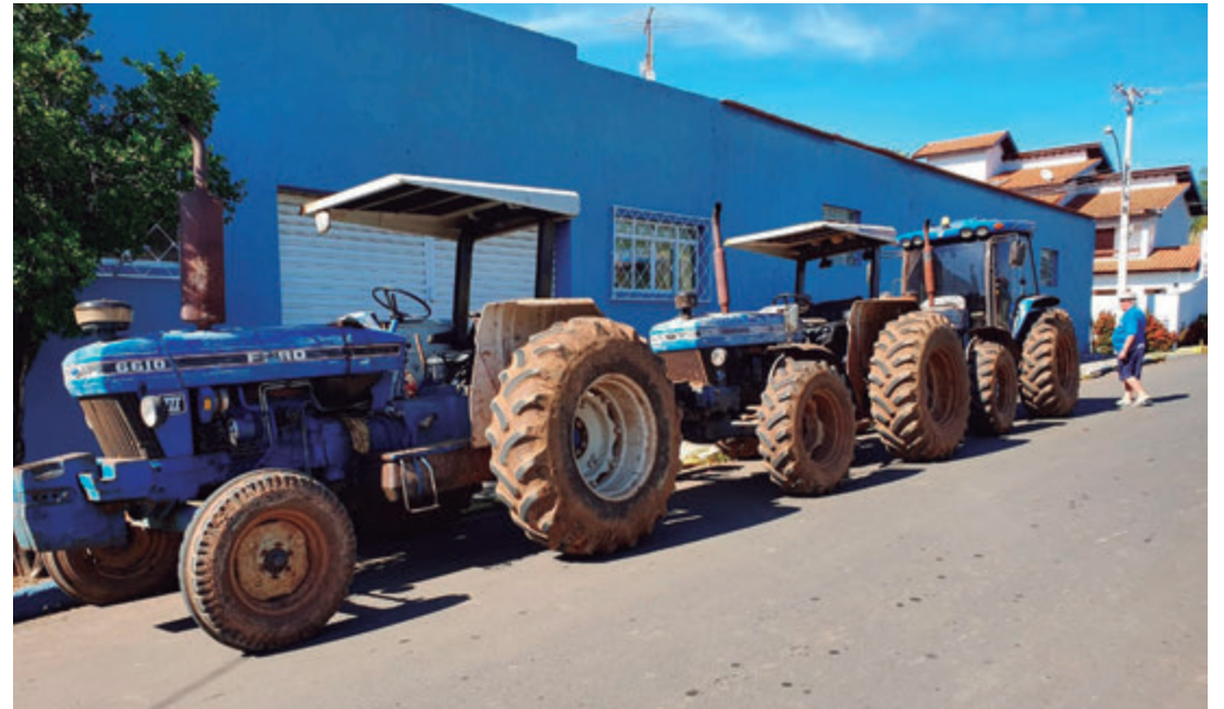
Tratores encontrados em canal de Mombuca foram furtados de fazenda em Rio das Pedras

Três tratores que tinham sido furtados de uma fazenda em Rio das Pedras foram encontrados em um canal em Mombuca.