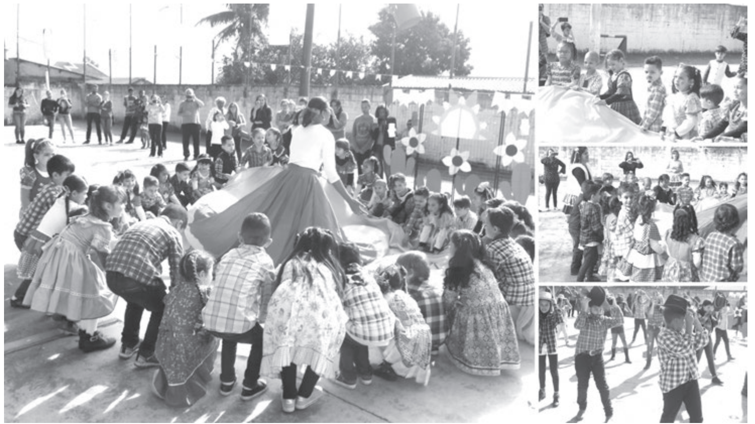
Apresentações aconteceram nas três escolas municipais de Rafard - Aurélio Sotto, Luis Grellet e Josefina Chiarini Borghesi