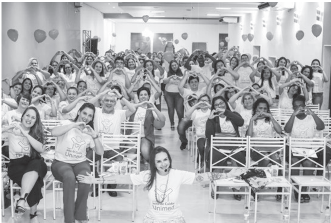
Colaboradores e médicos participaram de evento no salão de festas do Mama Mia II

A Diretoria da Unimed Capivari resume à tarde do dia 15 de junho como esplendorosa. Aproximadamente 200 pessoas entre médicos e colaboradores estiveram reunidas no salão de festas Mama Mia II, para aprenderem uma nova filosofia de trabalho que é o Jeito de Cuidar.