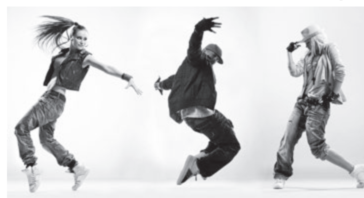
Concurso recebe inscrições de toda região

Haverá disputas nas modalidades Breaking 2x2, Seven Smoke e Cypher, com premiação em dinheiro para o primeiro colocado e kits. Presença confirmada do