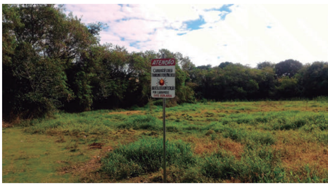
Placas foram colocadas em pontos onde pode haver a presença de carrapato estrela

De acordo com o Ministério da Saúde, a partir da suspeita médica da bactéria, causadora da Febre Maculosa, o tratamento com antibióticos deve ser iniciado imediatamente, não se devendo esperar a confirmação laboratorial do caso. Quanto mais rápi-