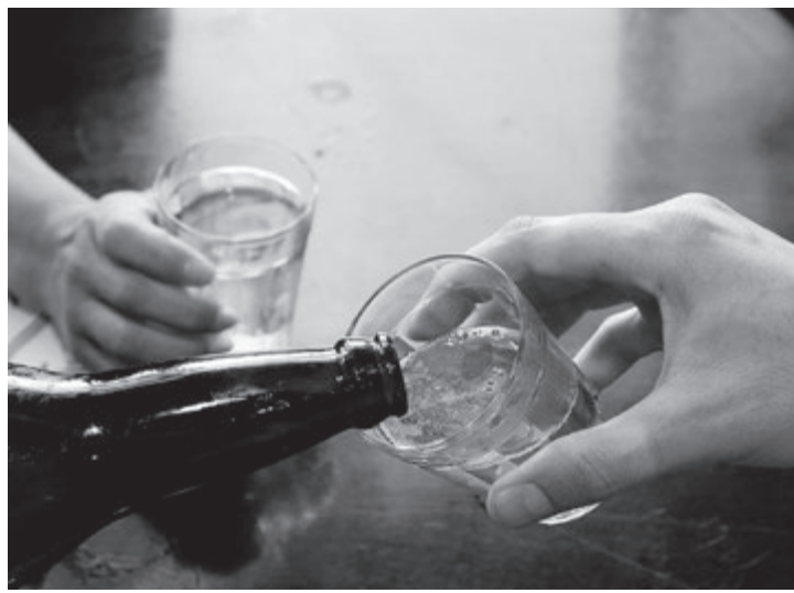
Retorno do churrasco não acabou bem para homem de 50 anos (Foto ilustrativa)

Segundo nota da Prefeitura de Capivari, os guardas tiveram que conduzir o indiciado, até o Pronto Socorro local, pois ele estava totalmente fora de si. O homem