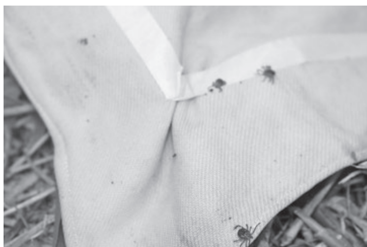
Carrapatos foram levados para análise

Ainda no local, foram encontradas fezes de capivaras, um dos principais animais responsáveis pela transmissão do carrapato-estrela. Devido a isso, a Vigilância Sanitária irá colocar placas de alerta no local, além de orientar a população.