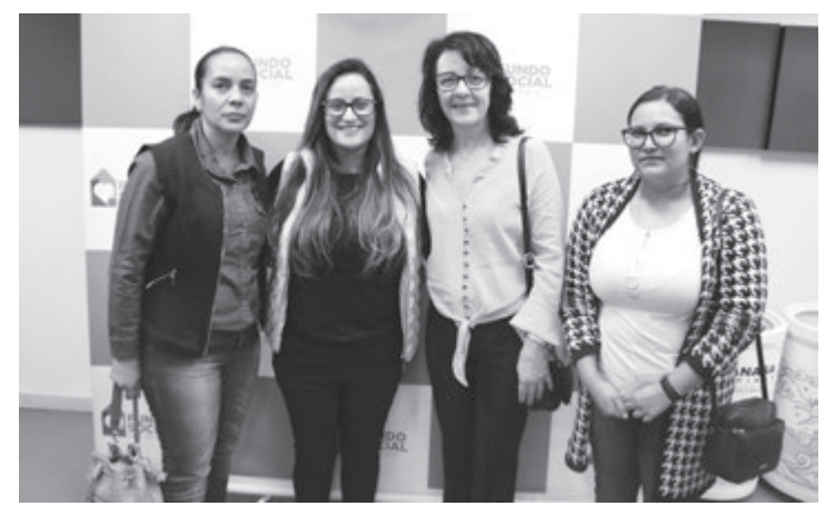
Representantes rafardenses no evento

A primeira-dama do município explica que, agora, todos os cursos serão uniformes, com professores e insumos custeados pelo Estado.