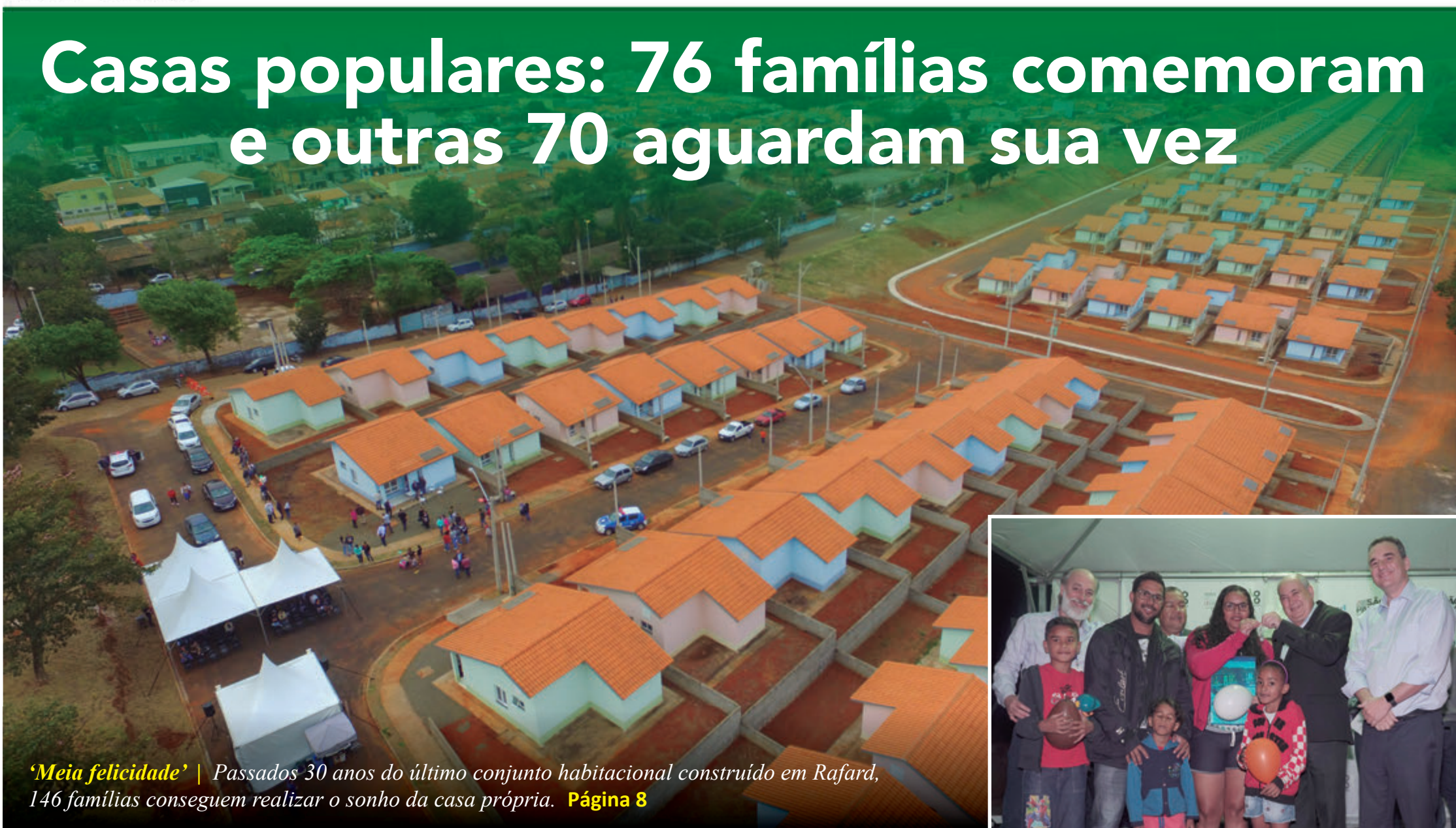
'Meia felicidade' | Passados 30 anos do último conjunto habitacional construído em Rafard, 146 famílias conseguem realizar o sonho da casa própria. Página 8