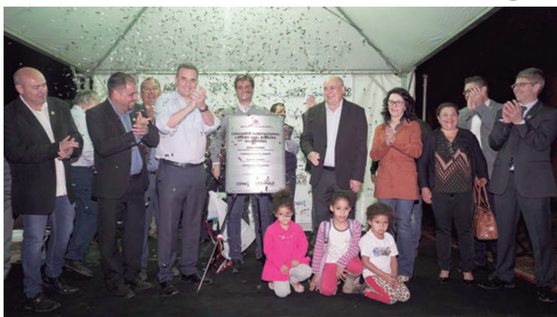
Evento reuniu autoridades do Estado e do município para entrega das chaves

"Se fosse fácil, já tava feito. Vamos enfrentar as dificuldades e em breve entregar essas outras unidades. Faço questão de estar aqui pra gente entregar