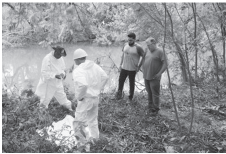
Coleta aconteceu próximo ao Rio Capivari

Duas técnicas foram utilizadas para a captura dos hematófagos (ani-