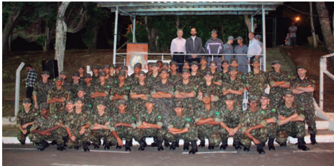
Integrantes do TG de Capivari, que comemora o Dia do Soldado neste sábado

Uma solenidade está marcada para este sábado (24), em comemoração ao “Dia do Soldado”. A formatura militar, alusiva à data comemorativa, acontecerá às 18h30 na sede do TG, localizada na rua João Vaz, 1.160, no Centro. A ocasião contará com os atiradores e ex-atiradores.