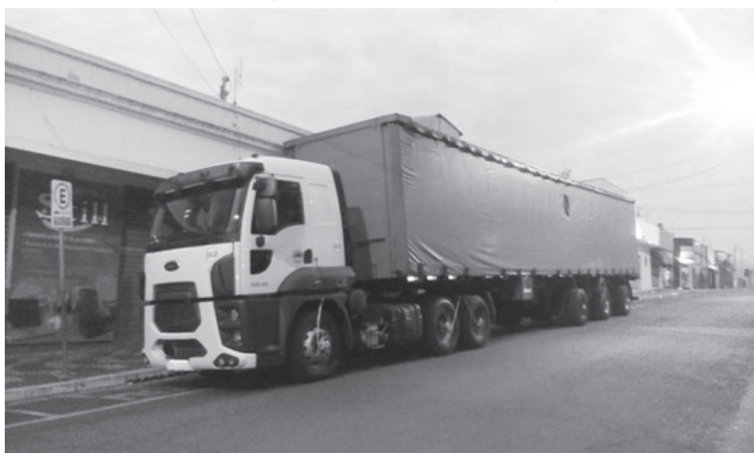
Caminhão foi encontrado na Rodovia do Açúcar pela equipe da Guarda Municipal

Segundo informações, o motorista foi amarrado e teve os olhos vendados e, logo depois,