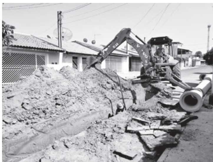
Implantação do coletor de esgoto Central na avenida Ismael Bueno de Oliveira

“Compreendemos que as obras trazem transtornos, mas é de