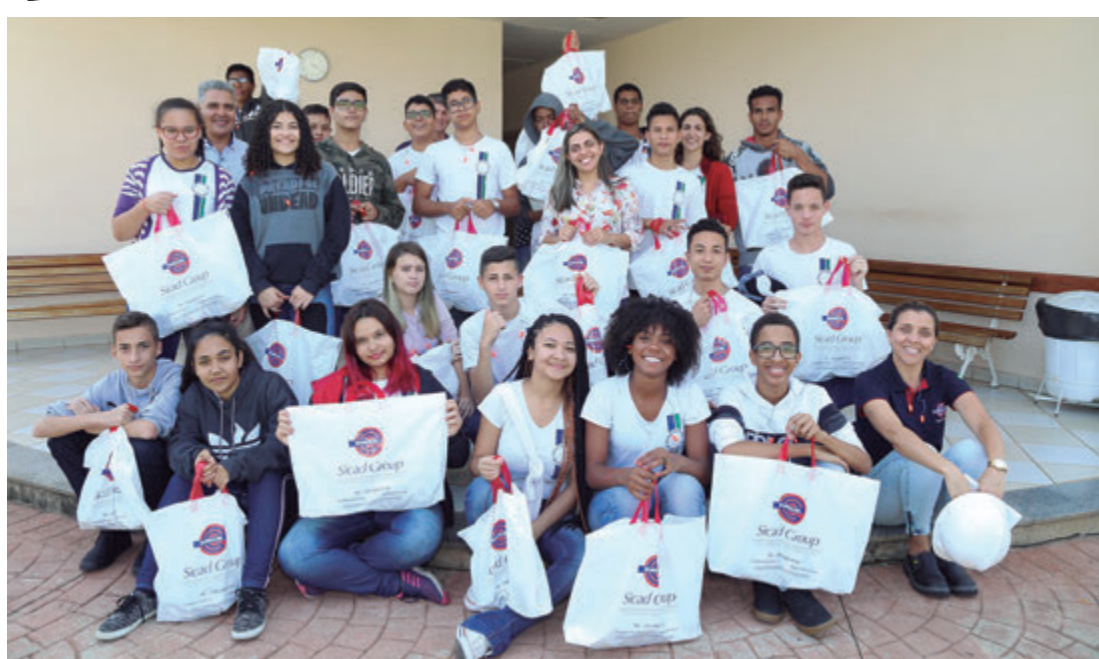
Alunos da escola Laura durante visita à empresa SICAD