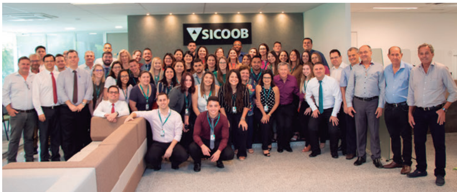
Funcionários da agência de Capivari, diretoria e conselho no primeiro dia de 'casa nova'

Na manhã do dia 14, a recepção para os funcionários da agência e da unidade administrativa contou com a presença de membros do conse-