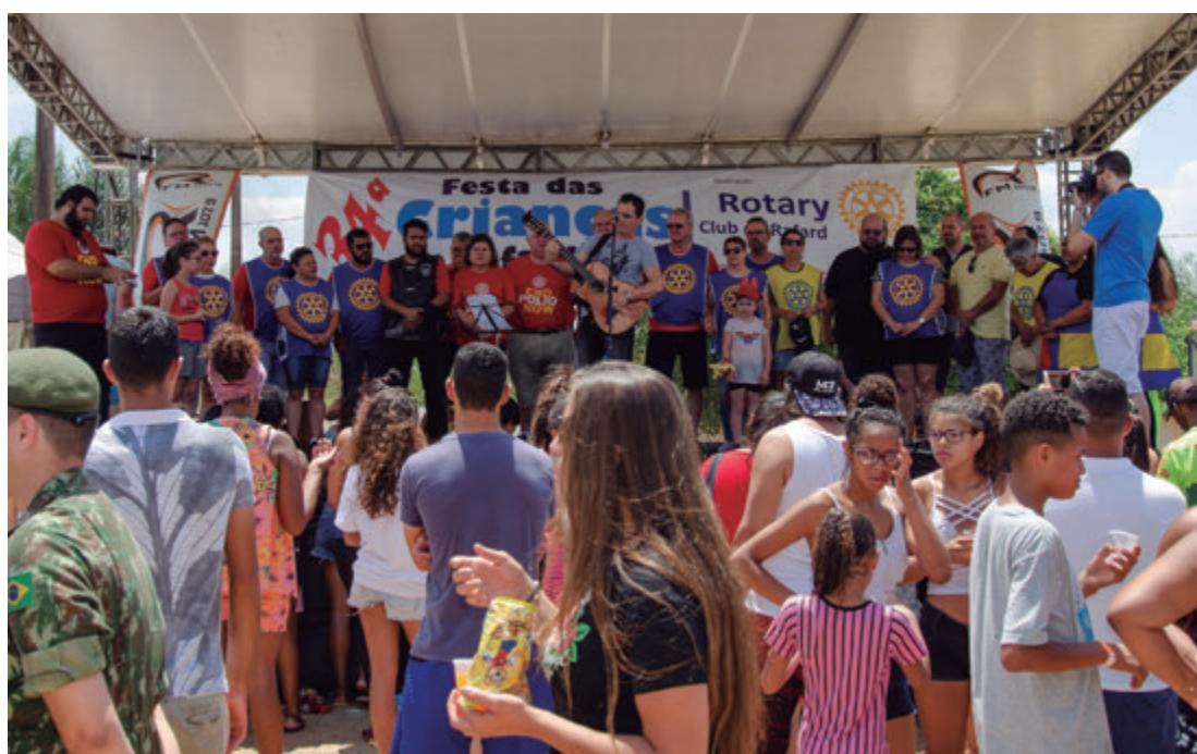
Encerramento contou com música e oração em homenagem à Nossa Senhora Aparecida

as expectativas e foi um sucesso novamente. "Foram meses de preparação e muito trabalho na véspera da festa para deixar tudo pronto, mas tudo isso não significa quase nada perto do sorriso e da alegria destas crianças que todos os anos lotam a Festa das Crianças do Rotary".