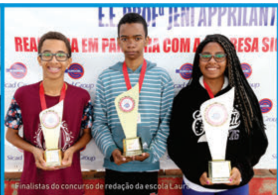
Finalistas do concurso de redação da escola Laura