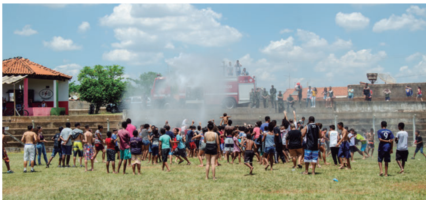
Corpo de Bombeiros de Capivari proporcionou a tradicional chuva de prata antes do fim da festa, no campo do centro esportivo