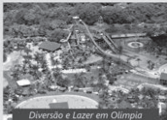
Diversão e Lazer em Olímpia