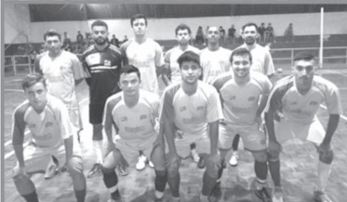
Quatro equipes que estrearam na quarta-feira

Quatro equipes estrearam na primeira rodada do Campeonato Regional de Futsal de Rafard. Os jogos aconteceram na noite de quarta-feira (23), no ginásio municipal de esportes Olavo de Campos Borghesi.