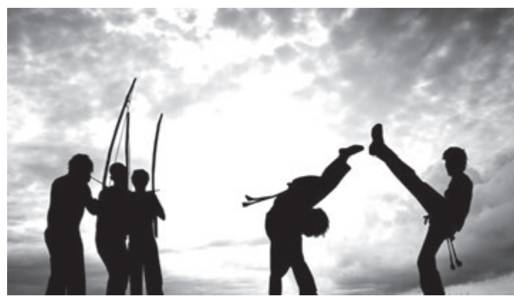
Batizado acontece no Lions Clube, neste sábado (26)

Neste sábado (26), 35 crianças em situação de vulnerabilidade receberão a primeira graduação infantil de capoeira, a corda cinza e verde. O evento acontece às 9h, no Lions Clube de Capivari e marca o batizado e troca de cordas de Capoeira da Casa da Criança de Capivari.