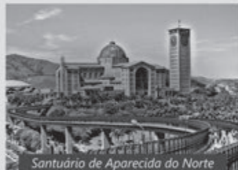
Santuário de Aparecida do Norte

MONTE SUA EXCURSÃO PARA UM DESTES DESTINOS: