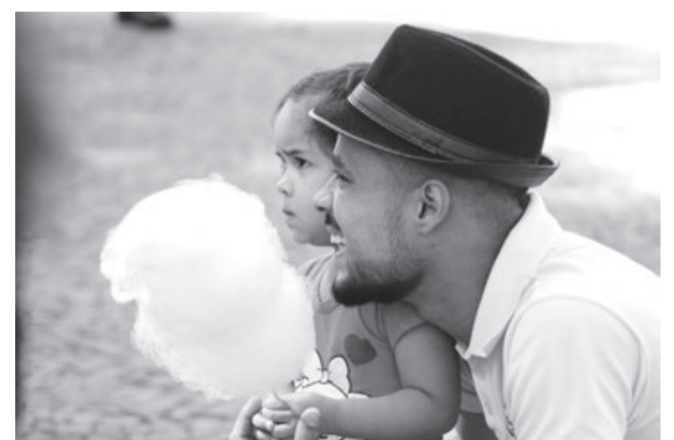
Festa acontece na Praça Central

Em 2018, a festa foi um sucesso e levou mais de 3 mil pessoas à praça. Neste ano, a rádio vai oferecer brinquedos infláveis e camas elásticas, totalmente gratuitos, além da distribuição de 1500 kits com sorvete, algodão doce, pipoca e refrigerante para a crian-