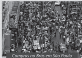
Compras no Brás em São Paulo