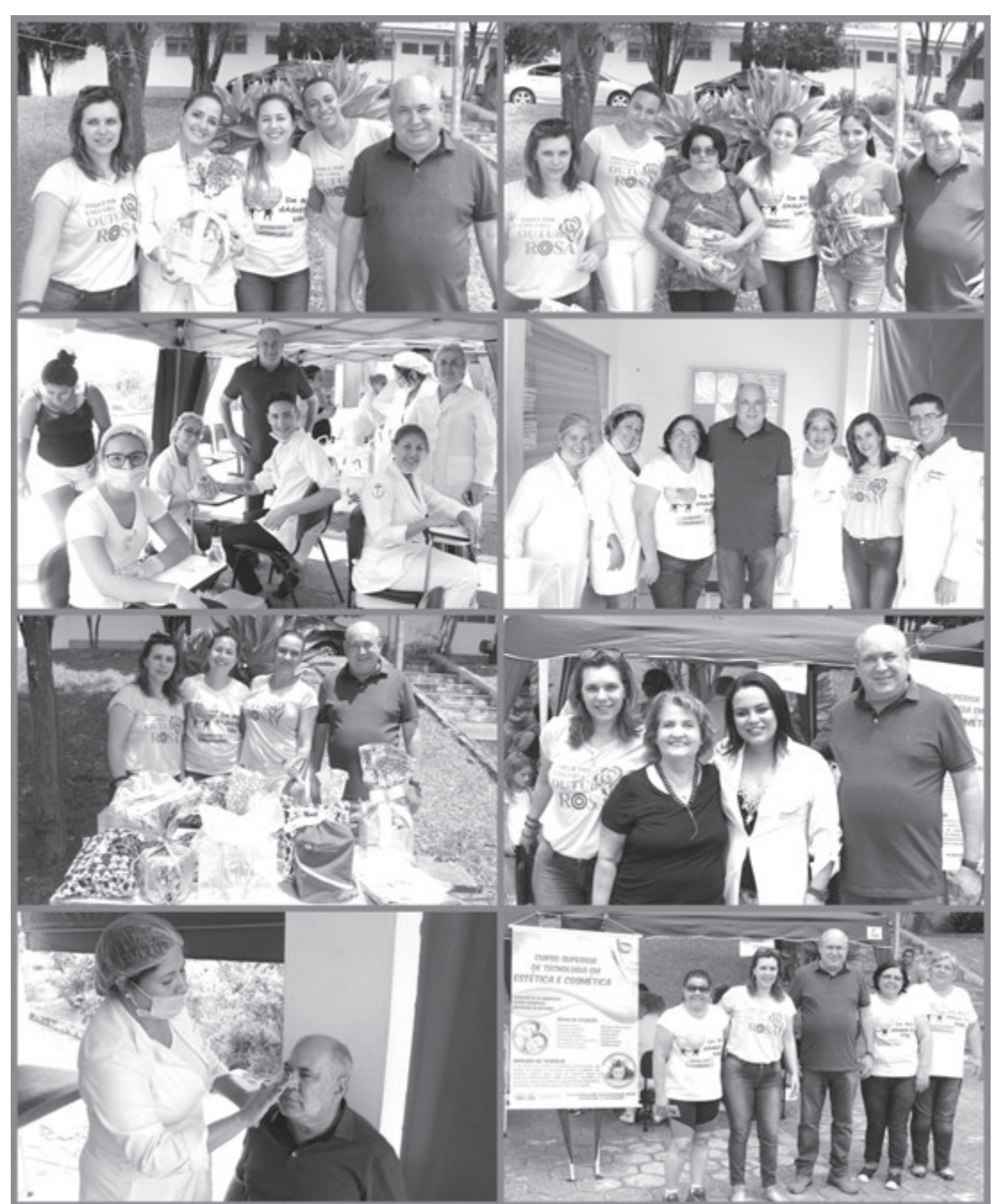
Atividades aconteceram no pátio da Unidade Básica de Saúde do município

O sábado (19), foi de ações voltadas a Saúde em Rafard, com atividades do Outubro Rosa e o Dia D da vacinação de sarampo na Unidade Básica de Saúde. O prefeito Carlos Roberto Bueno fez questão de prestigiar o evento.