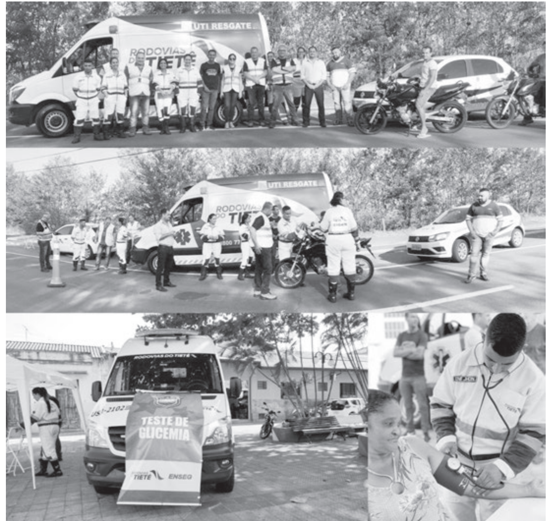
Atividades coordenadas pela concessionária aconteceram em vários pontos

Preocupada com as ações de prevenção no município, a Prefeitura de Rafard e a Concessionária Rodovias do Tietê firmaram uma parceria para a realização de cuidados na área da saúde e orientações de trânsito. O trabalho ocorreu na última sexta-feira, dia 18, na Praça da Bandeira e próximo ao Distrito Industrial.