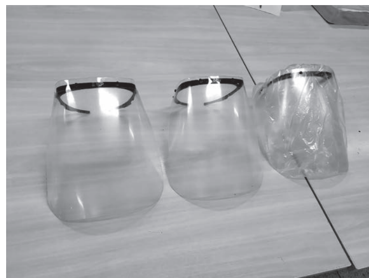
Viseiras de proteção produzidas em impressoras 3D no Instituto Federal Câmpus Capivari que serão doadas ao município