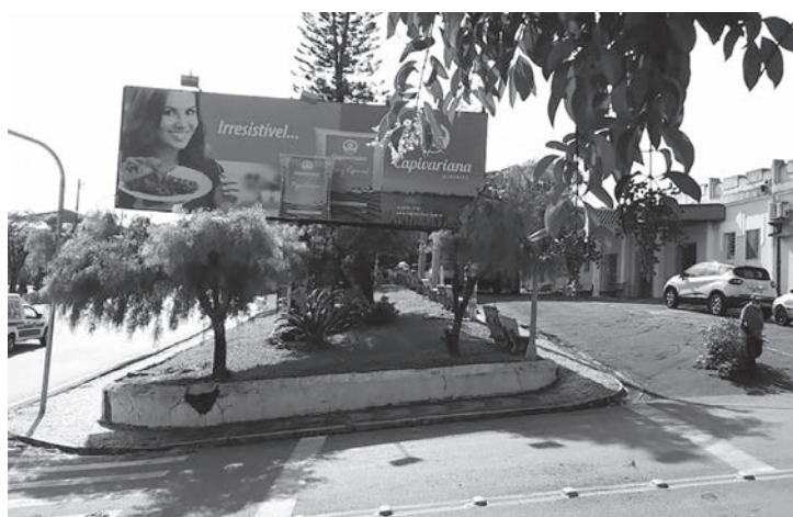
Outdoor fica no canteiro de entrada da Santa Casa de Misericórdia de Capivari

do aluguel do outdoor, segundo Tedeschi, foi negociado acima dos valores praticados no mercado, resultando em uma quantidade muito maior de alimentos.