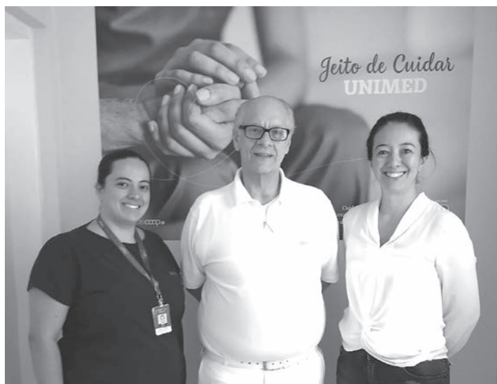
Estudo será apresentado em Portugal, na 5ª Conferência Bienal Europeia da Sigma Internacional

O estudo que será apresentado na Conferência é a “Efetividade do Polihexametileno – Biguanida (PHMB)” no tratamento de lesões em