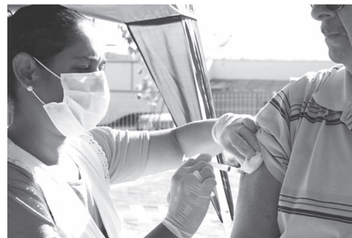
Segunda etapa começa no dia 16 de abril

Por último, a campanha de vacinação contra o vírus da gripe Influen-