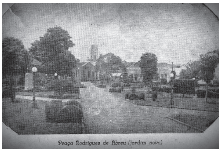
Praça Rodrigues de Abreu (jardim novo)

Hoje, folheando um livro antigo do ano de 1958, por coincidência o ano do meu nascimento, e que foi publicado para homenagear os 126 de glórias e de tradições de Capivari, me deparei com publicações muito interessantes que merecem ser lembradas e por isto aos poucos irei republicá-las neste Semanário.