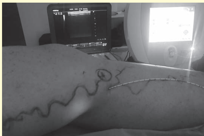
Procedimento de safenas das pernas

A Unimed de Capivari, através da equipe de cirurgia vascular, realizou o novo procedimento para tratamento de varizes de membros inferiores com a utilização de Endolaser, da empresa Tecmesic, no último dia 14.