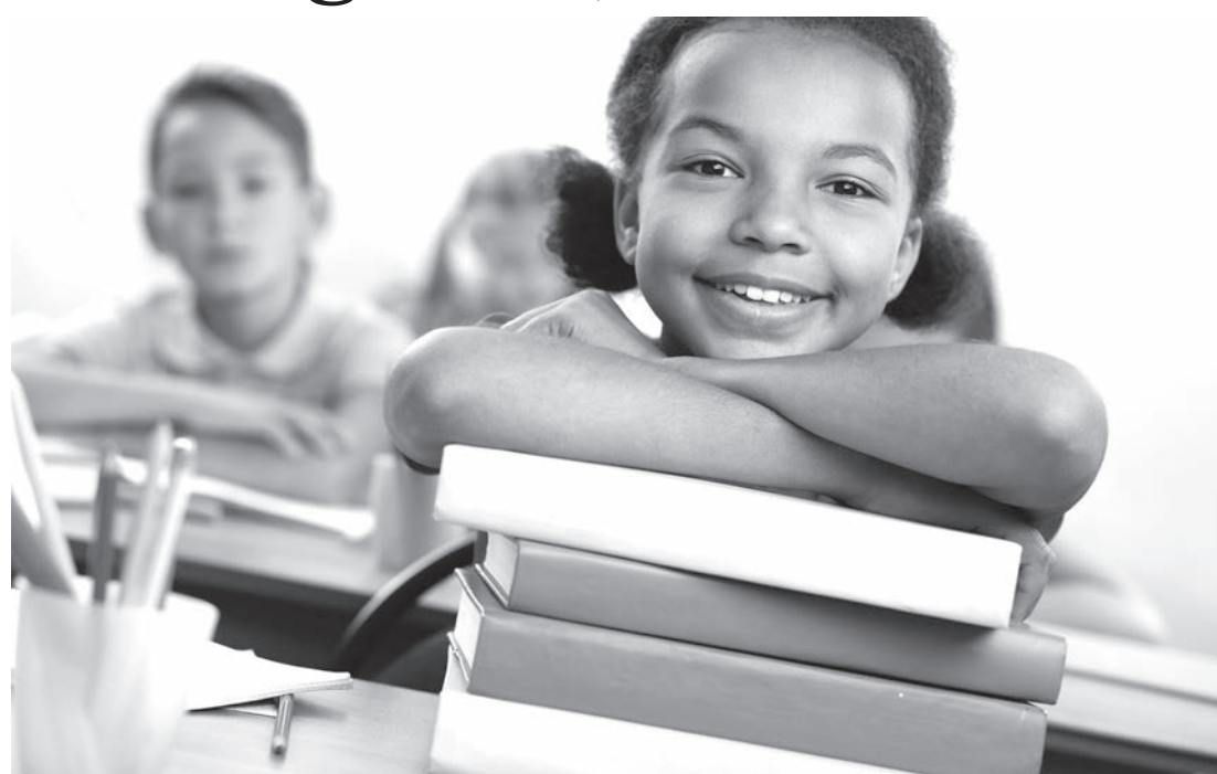
Avaliação é realizada a cada dois anos em todo país; Rafard está acima da média nacional (Foto ilustrativa)