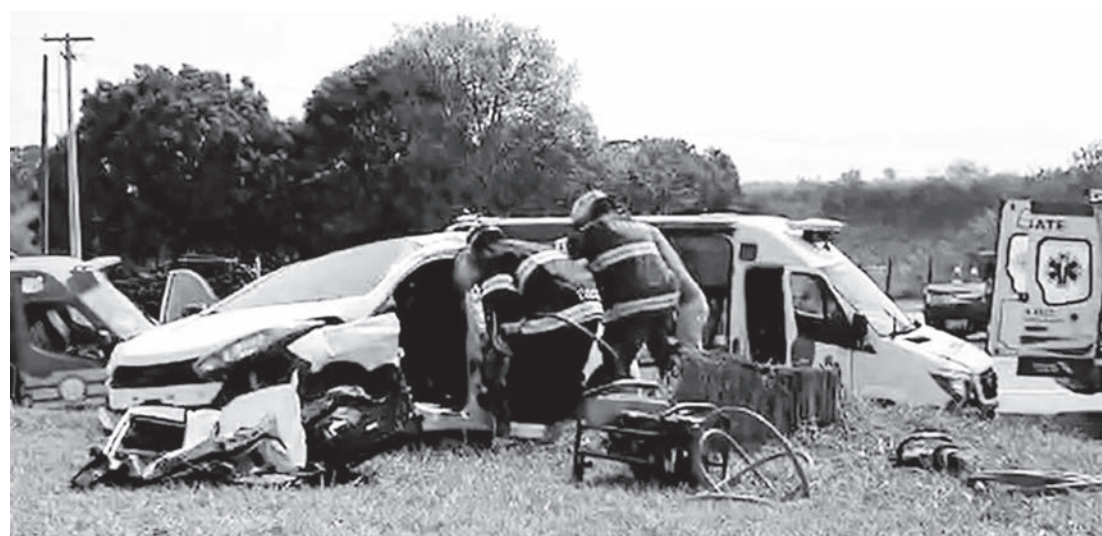
Acidente ocorreu no quilômetro 42 da Rodovia Jornalista Francisco Aguirre de Proença

tavam no HB20. As duas que estavam nos bancos da frente do veículo ficaram presas nas ferragens e, após o resgate, foram levadas em estado grave