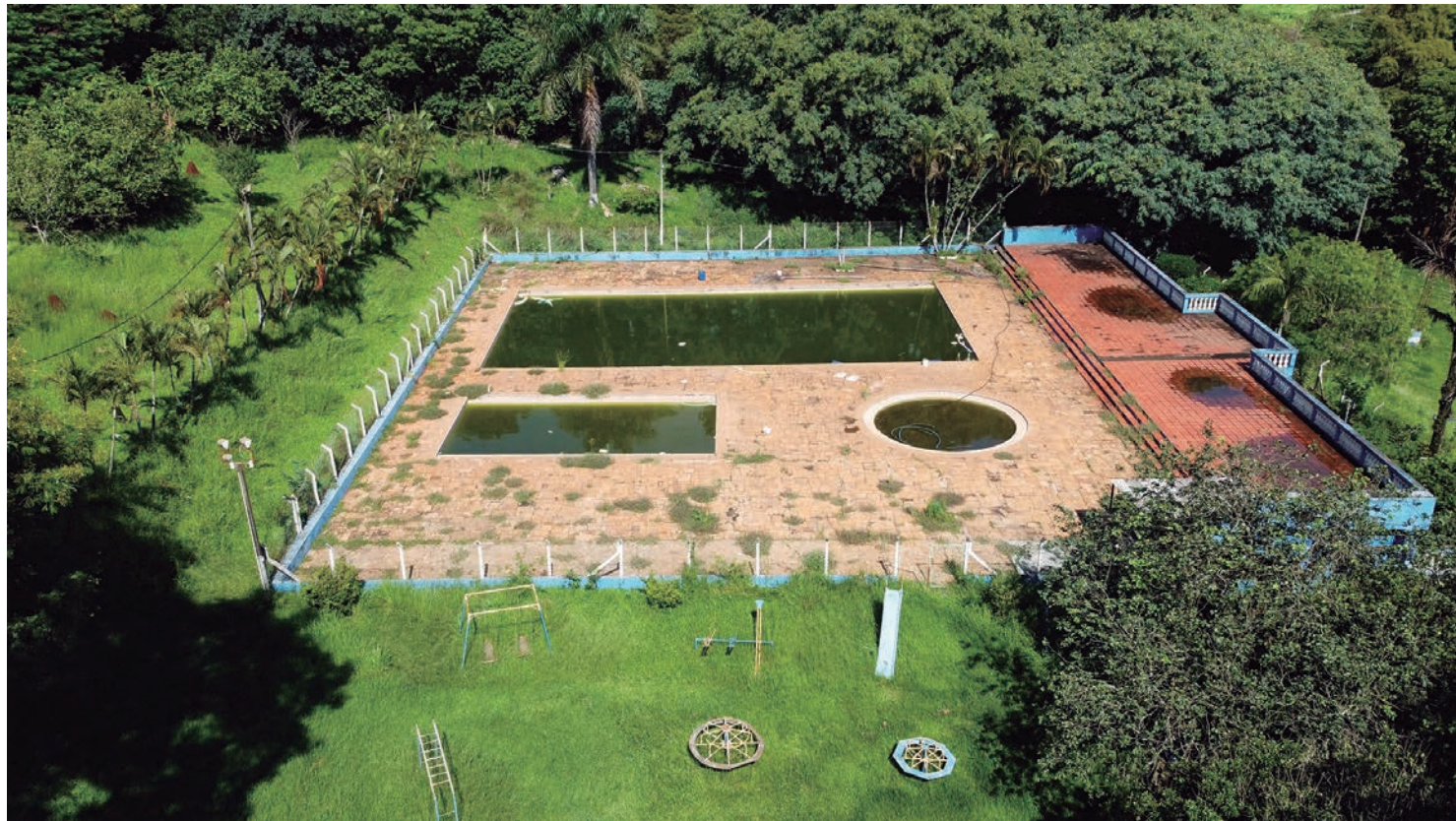
Piscinas estão sem tratamento e o entorno sendo ocupado pelo mato; Vigilância Sanitária de Rafard esteve no local

Ela relata que em 2020 foram cancelados dois bailes e os tradi-