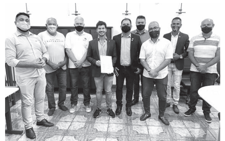
Deputado recebeu pedido de verba assinado em conjunto entre Executivo e Legislativo

O prefeito aproveitou para agradecer o apoio do Deputado, reforçando a seriedade e competência do seu trabalho. “O bom relacionamento político nos permite isso, grandes parcerias que visam trazer recursos e possibilidades de crescimento para Capivari. Essas verbas serão de extrema utilidade para diversos projetos que temos em andamen-