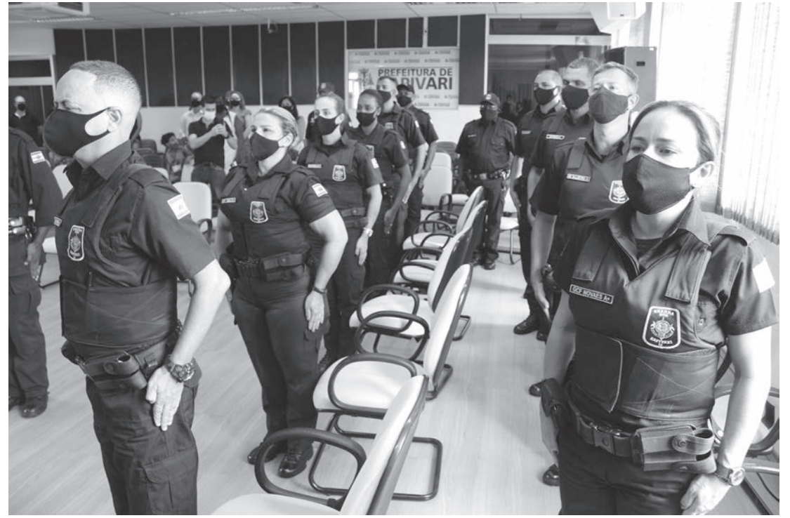
Novos guardas foram recepcionados em solenidade no plenário do Executivo

A Secretaria de Segurança Pública nomeou 10 novos Guardas Civis na manhã de quinta-feira (14), numa solenidade realizada no plenário da Prefeitura de Capivari. O evento foi realizado com todas as normas de distanciamento social, uso de máscara e álcool em gel, num ambiente arejado.