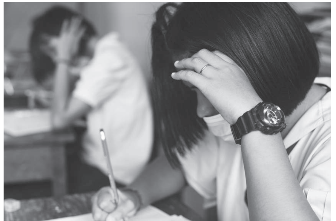
Alunos matriculados nas escolas estaduais e municipais devem retomar estudos em fevereiro (Foto ilustrativa)

O Ensino Híbrido não será válido para as cre-