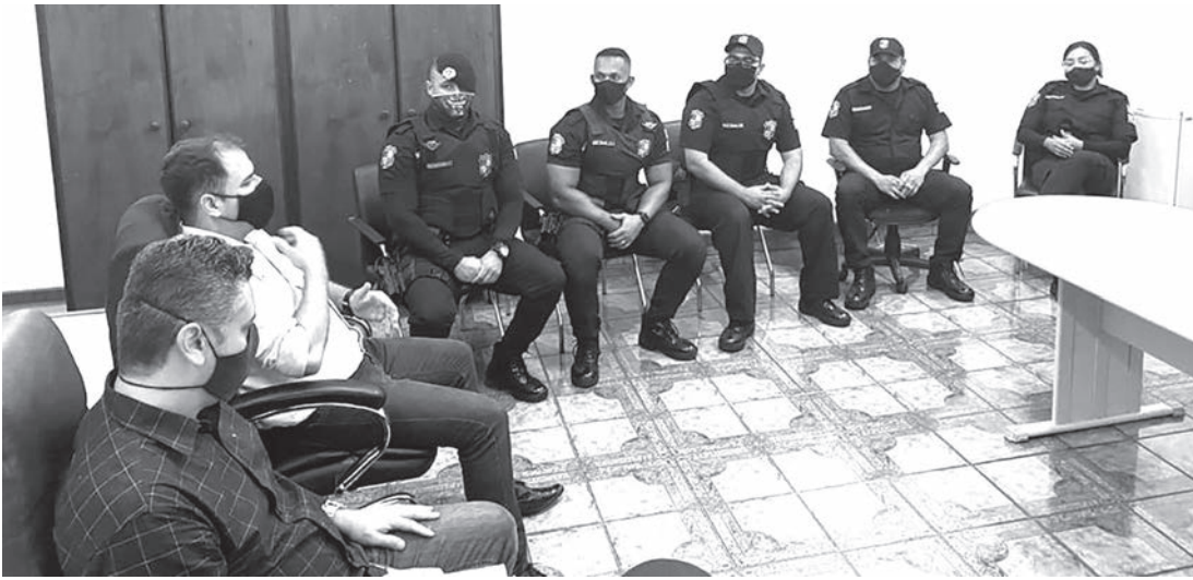
Novo comandante da Guarda Civil de Rafard também foi anunciado oficialmente