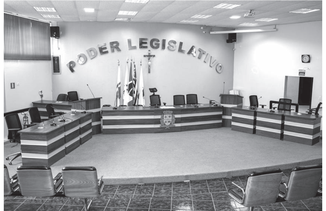
Por enquanto, plenários das câmaras municipais continuam vazios

Ainda estão em recesso as Sessões Ordinárias do Legislativo, em 2021. Os novos vereadores, eleitos para o mandato 2021/2024, iniciam seus trabalhos a partir de fevereiro.