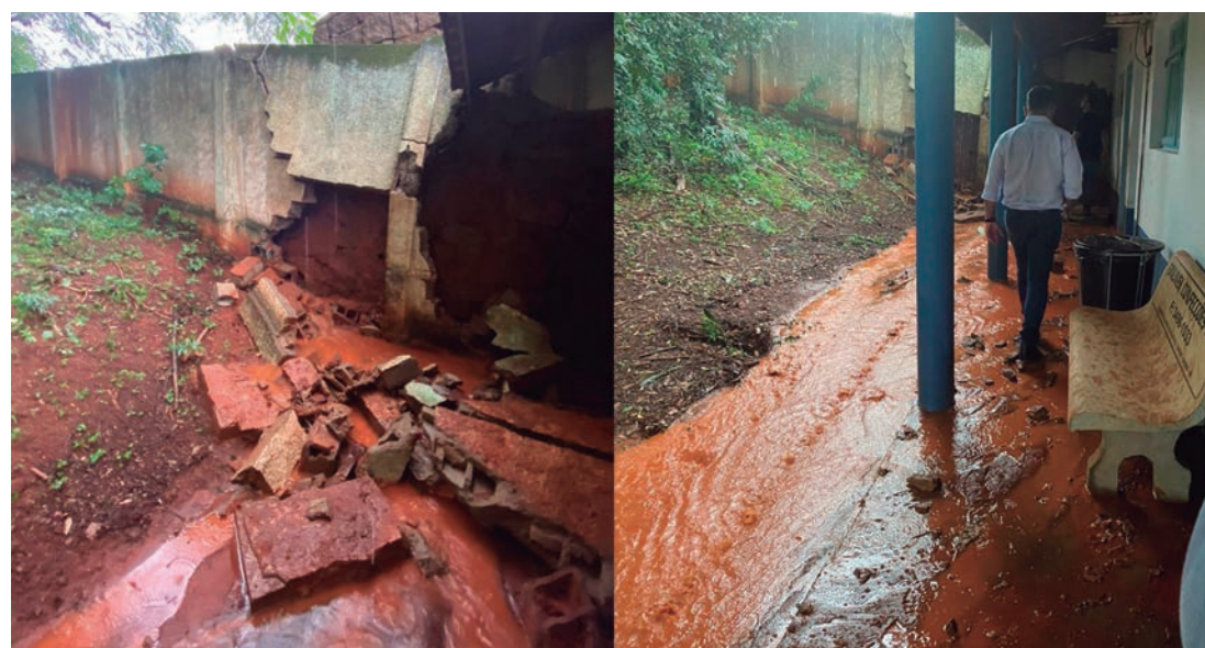
Fortes chuvas causaram prejuízos na Unidade Básica de Saúde de Rafard