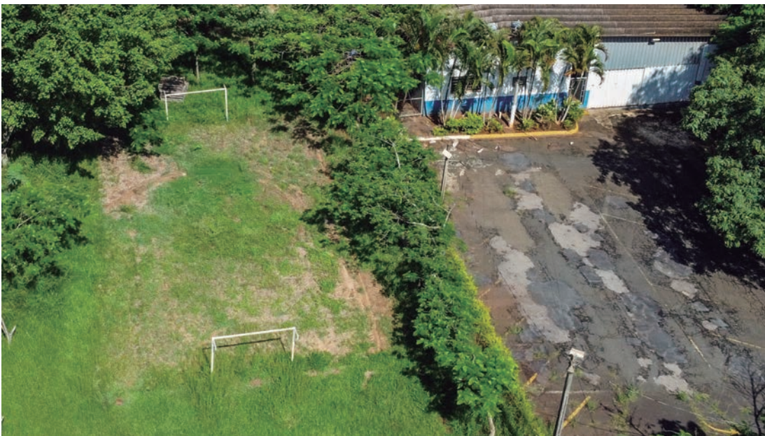
Quadra de areia foi tomada pelo mato e árvores necessitam de poda

O clube possui também um amplo estacionamento e uma sauna para os associados.