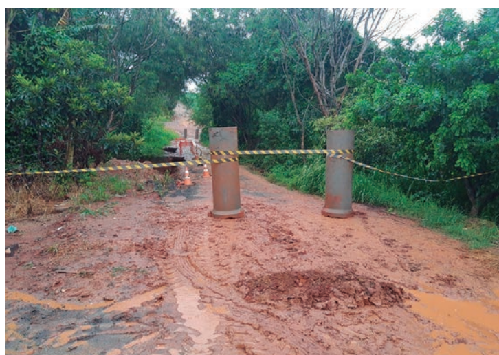
Passagem que liga o bairro Popular à Capivari foi interditada pela Defesa Civil após desabamento de terra nas laterais

A Defesa Civil dos dois municípios, orienta que a população, que mora em áreas com risco de alagamento ou desabamento, permaneça em alerta. Em Capivari o telefone para acionar em caso de urgência é pelo 199 ou com a Guarda Civil pelo 153. Em Rafard, o telefone da Guarda Civil é o 3496-2027.