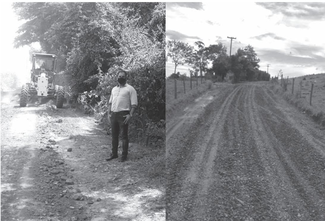
Prefeito Fabinho Santos acompanhou serviços na área rural do município

A Prefeitura de Rafard realizou nesta semana alguns serviços públicos de limpeza e manutenção tanto em área urbana quanto na zona rural.