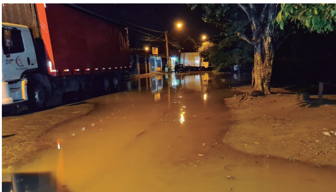
Caminhões auxiliam na retirada dos móveis das casas atingidas pelas águas

Em Rafard, as chuvas deixaram vários estragos, entre os mais sérios estão os prejuízos causados na Unidade de Saúde. Além das infiltrações