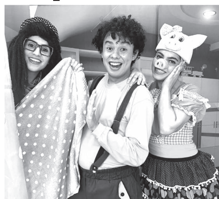
Atores estarão em Rafard a partir desta sexta-feira

Sobre a prevenção contra o coronavírus, o Grupo Imagini afirma