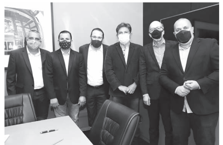
Deputado se reuniu com autoridades de Elias Fausto