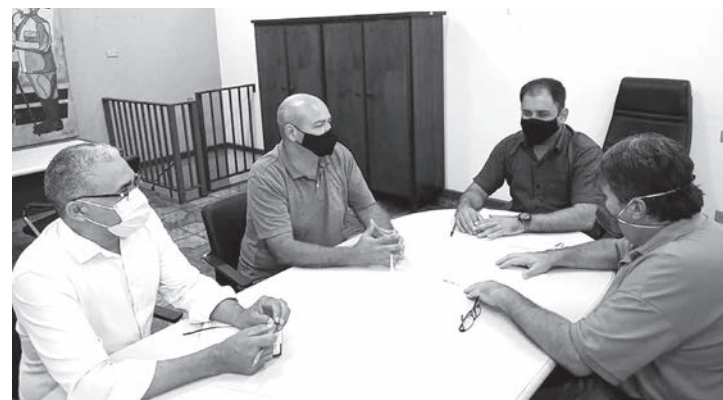
Obras foram discutidas durante reunião na prefeitura

“O prefeito entendeu a urgência da reforma, e vai dar início no processo de licitação, com acompanhamento do setor de obras, uma vez que o prédio está cedido para a prefeitura, e sem estas obras exigidas, não será emitido o alvará de licença do Corpo de Bombeiros”, explicou