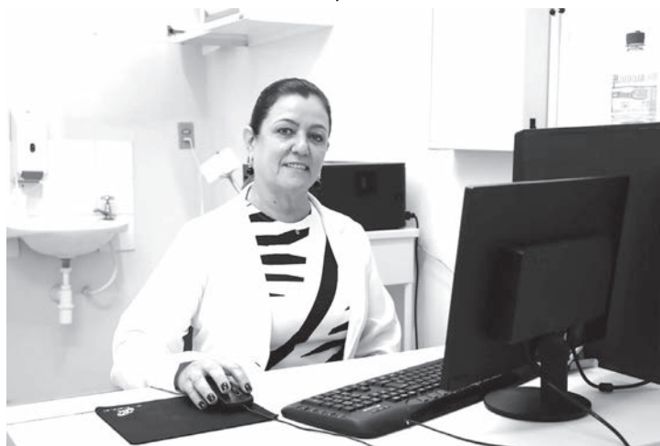
Dra. Ieda colaborou com informações sobre o tema

Outra forma de prevenção é o exame de Papanicolau, que é de ex-