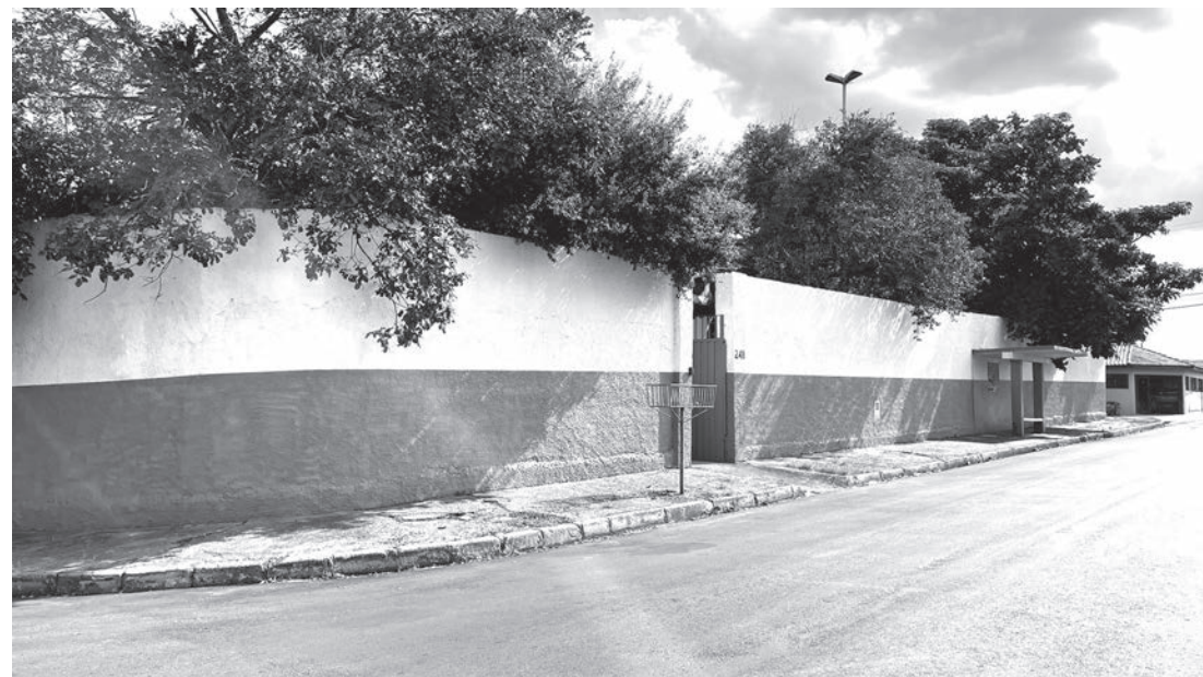
Espaço fica no prédio do antigo CRER, no bairro Popular, em Rafard

O Departamento Municipal de Água e Esgoto de Rafard está atendendo em novo endereço. O setor foi transferido para a rua Allan Rolim Barbosa, 248, no bairro Popular. O espaço fica no prédio onde funcionava o antigo CRER (Centro Recreativo Educacional de Rafard).