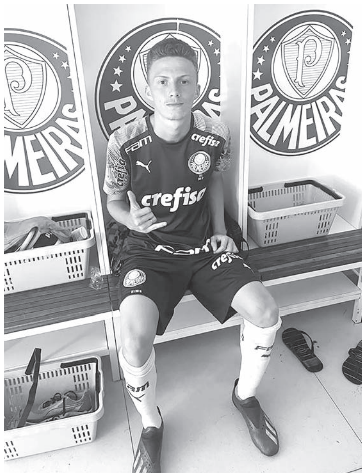
Jovem defende o clube alviverde na categoria sub17