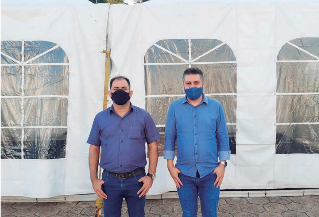
Tenda foi montada no pátio da Unidade Básica de Saúde; prefeito e vice visitaram local

A partir da próxima semana, o município de Rafard terá, no pátio da Unidade Básica de Saúde, o atendimento 24 horas para casos suspeitos de Covid-19.