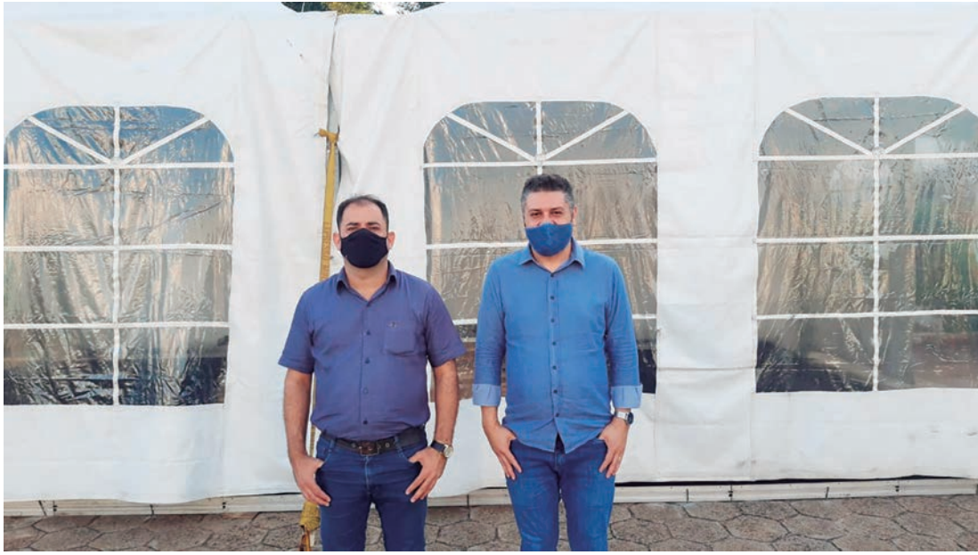
Medidas são emergenciais e visam ampliar atendimento dos casos. Página 9