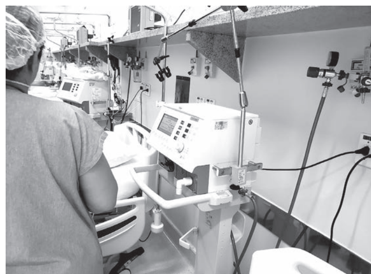
Falta de leitos de UTI faz Santa Casa suspender cirurgias eletivas

Segundo ele, o adiamento das cirurgias e procedimentos não urgentes reduz sensivelmente o número de pessoas circulantes no Hospital e deixa um número maior de leitos hospitalares livres para atender aos possíveis casos de pacientes infectados pela doença, demanda que tem aumentado de forma exponencial colocando as autoridades de saúde de todo o