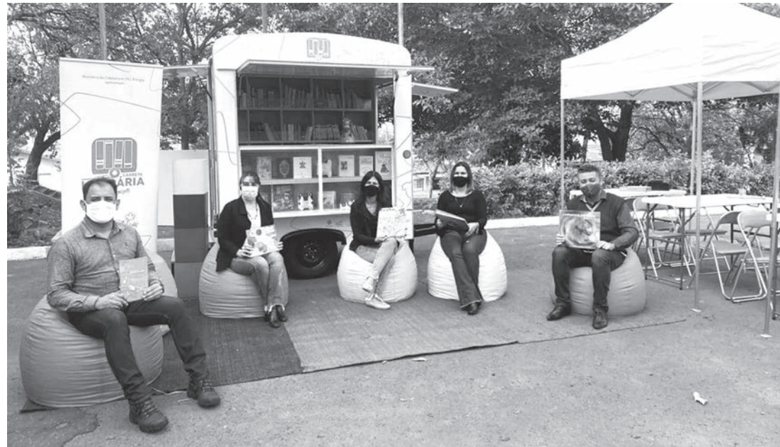
Carreta Literária ficará alocada na escola municipal Josefina Chiarini Borghesi

A rede municipal de Educação de Rafard foi contemplada, através de uma parceria com a CPFL (Companhia Paulista de Força e Luz), com a vinda da Carreta Literária, um projeto cuja finalidade é estimular o hábito da leitura.