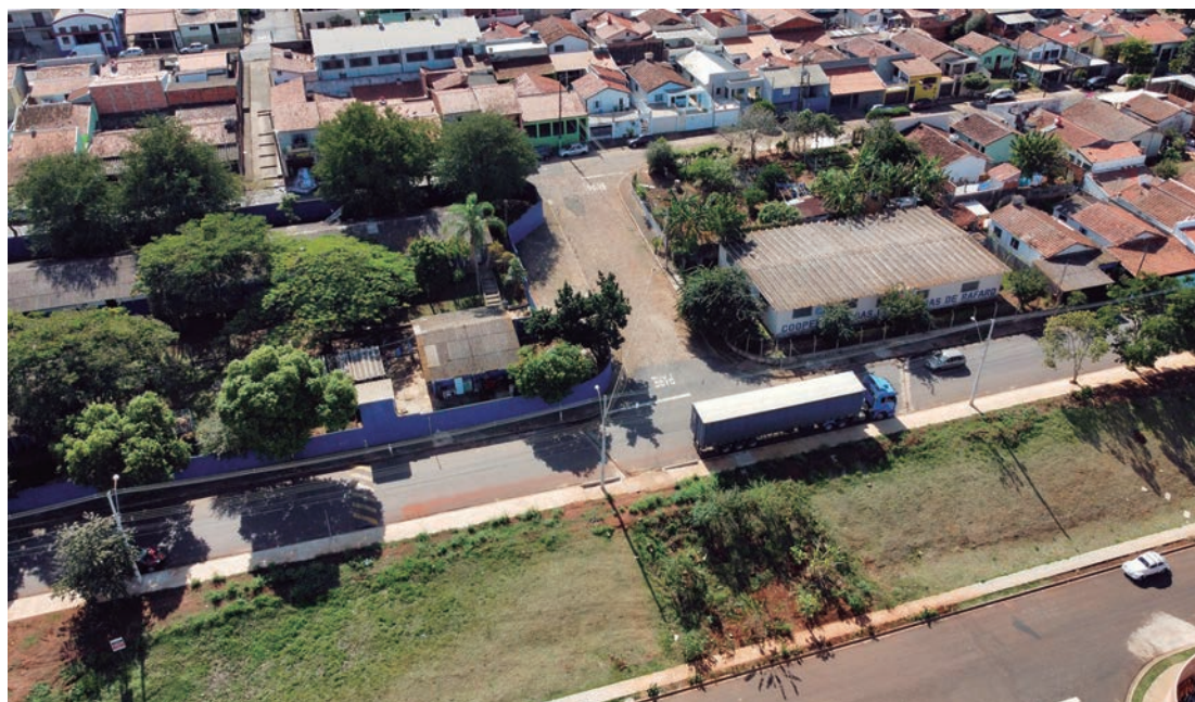
Barracão da antiga Cooperativa das Costureiras deverá ser unificado ao prédio da escola municipal