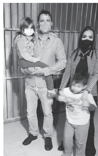
Gelinho e sua filha; Adriana e seu filho

“Nós, da Asturba, acreditamos que o contato com as diversidades torna a humanidade melhor. Com a nova diretoria da equidade vamos promover ações de inclusão, garantindo uma sociedade mais justa”, declara o presidente da