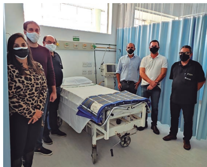
Leitos aguardam apenas aprovação do governo do Estado para atender pacientes adultos acometidos pela Covid-19