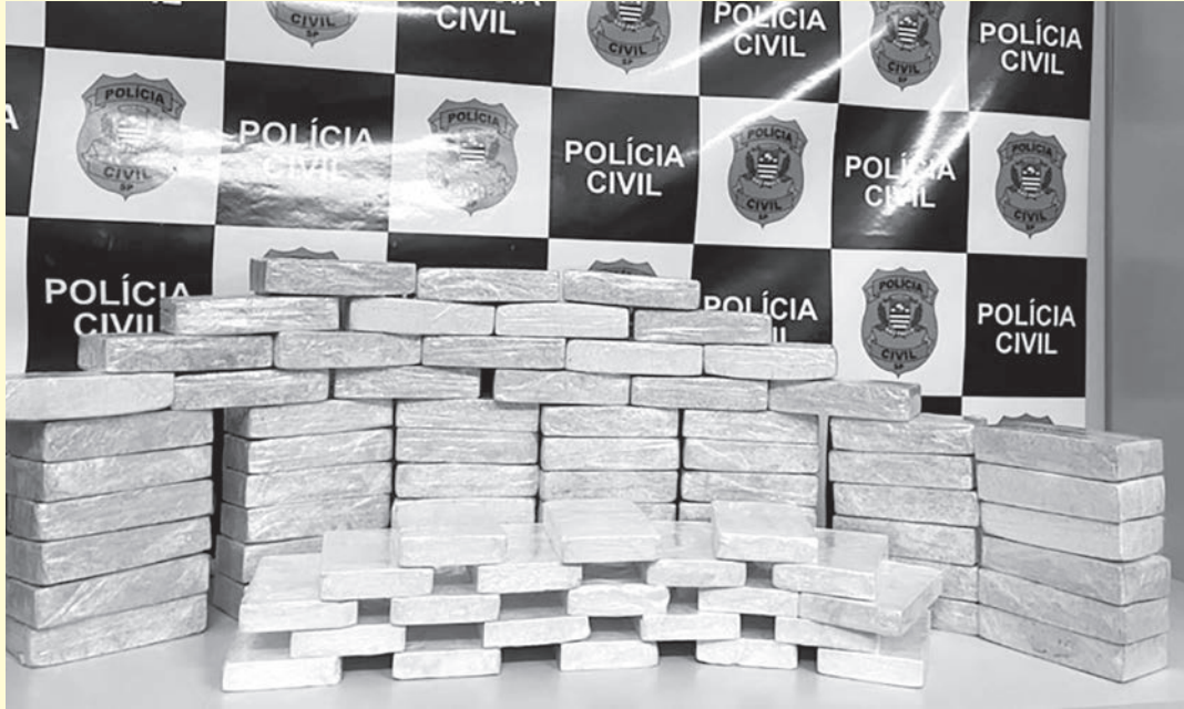
Tijolos de cocaína foram encontrados no veículo, abordado na Rodovia Francisco Aguirre Proença

A Polícia Civil prendeu um homem, de 29 anos, que transportava 81 tijolos de cocaína em um caminhão. O flagrante ocorreu no último sábado (17), em Rafard.