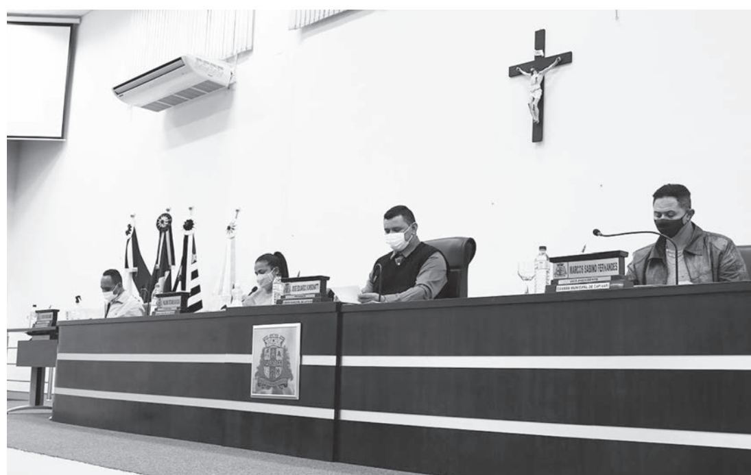
Mesa diretora que presidiu os trabalhos na sessão extraordinária da Câmara de Capivari

Os dois últimos projetos de lei votados e aprovados são de abertura de crédito adicional suplementar para o Saae (Serviço Autônomo de