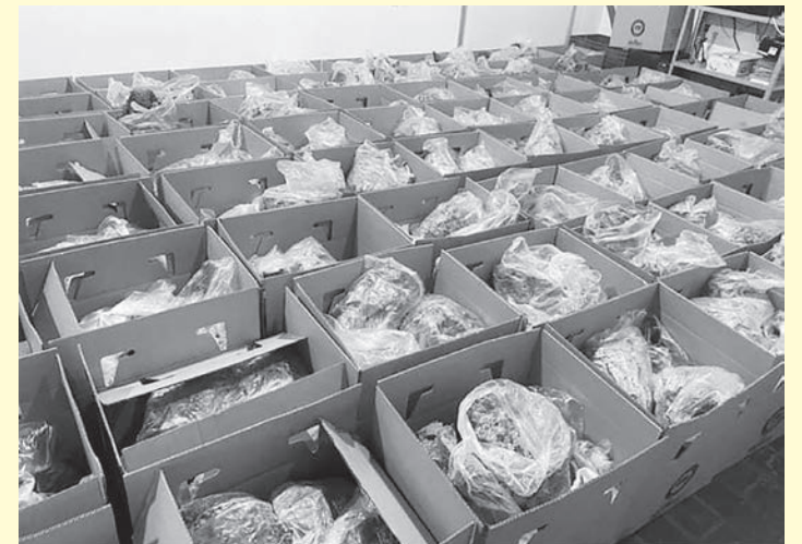
Município distribuiu 125 cestas verdes na última semana

O programa Cesta Verde é uma parceria do Governo do Estado com o Departamento Municipal de Agricultura e Departamento Municipal de Assistência Social, que tem por objetivo, incentivar a agricultura familiar no município e também fazer a diferença na vida das pessoas, com acesso à uma alimentação saudável.