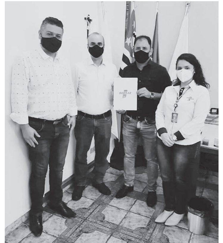
Termo de Compromisso foi assinado no gabinete do prefeito

Os serviços oferecidos serão: Orientações sobre abertura e melhoria de empresas (MEI, ME e EPP); Serviços do MEI; Realização de pa-