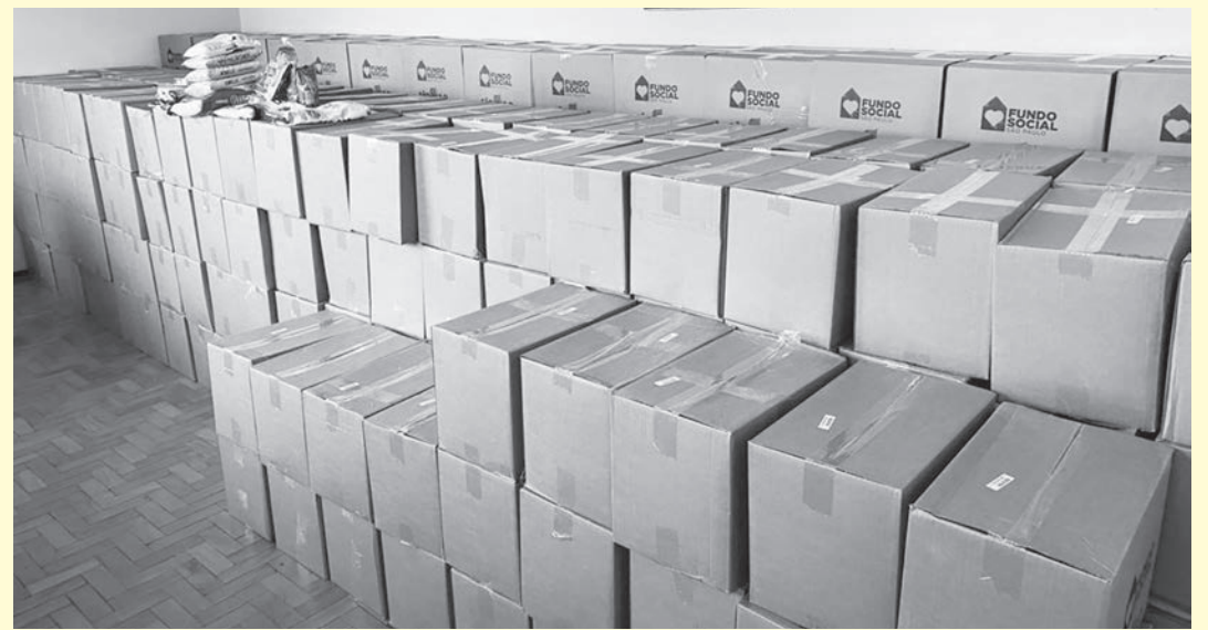
Fundo Social do Estado de São Paulo enviou 339 cestas básicas para Rafard

A Assistência Social de Rafard recebeu na última terça-feira (20), mais 339 cestas básicas do Fundo Social do Estado de São Paulo. Elas serão distribuídas às famílias que se encontram em vulnerabilidade social no município.