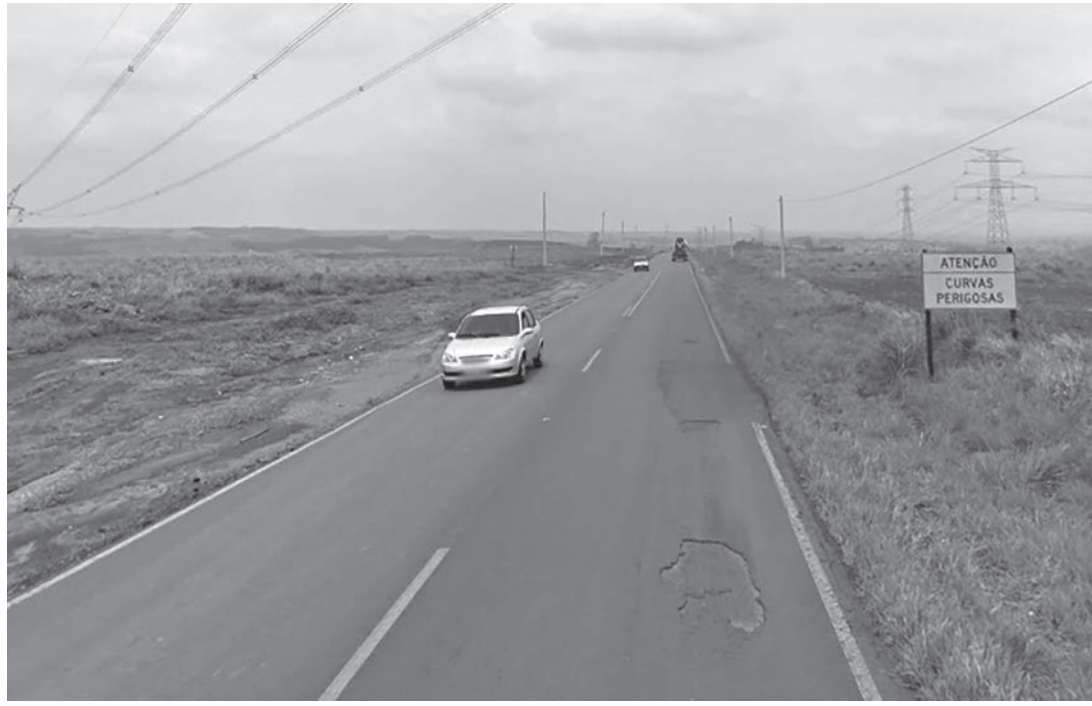
Motoristas cobram sinalização da vicinal que liga Rio das Pedras a Mombuca

a poucos metros da entrada de Mombuca, um motorista perdeu a vida quando dirigia pela pista. Ele capotou o veículo diversas vezes. A vítima era funcionário da Prefeitura de Mombuca.