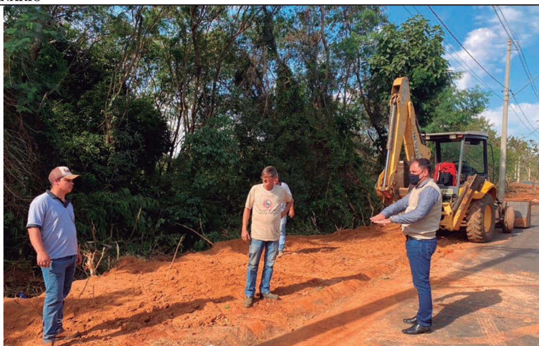
Obras | Melhorias devem contemplar 100% das calçadas no local

As informações são da Secretaria de Relações Públicas da Prefeitura de Capivari.