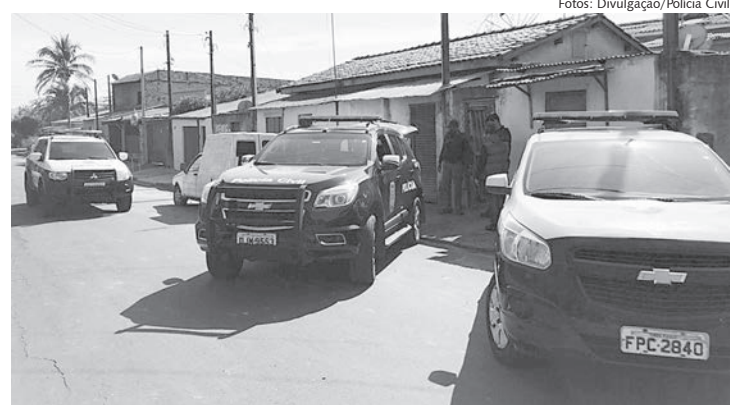
Primeira prisão aconteceu na segunda-feira (2)

A prisão aconteceu nesta quarta-feira (4). Além do mandado de prisão, o homem foi autuado em flagrante após a polícia localizar em seu imóvel, trezes munições calibre 38.