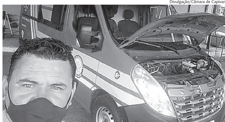
Du Bombonatti durante visita ao Corpo de Bombeiros de Capivari, em abril deste ano

O vereador explicou que, no momento, a viatura está