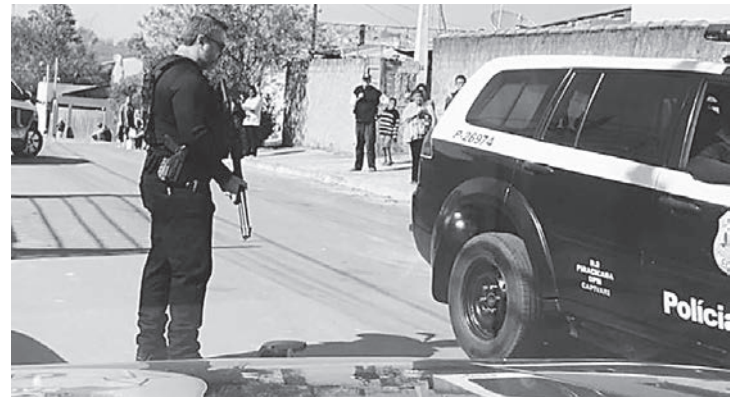
No caso de quarta-feira (4), a polícia encontrou projetis de arma de fogo na residência do acusado