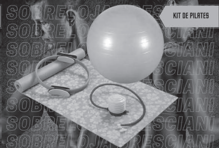
KIT DE PILATES