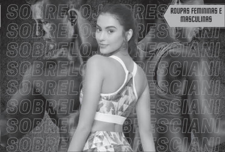
ROUPAS FEMININAS E MASCULINAS