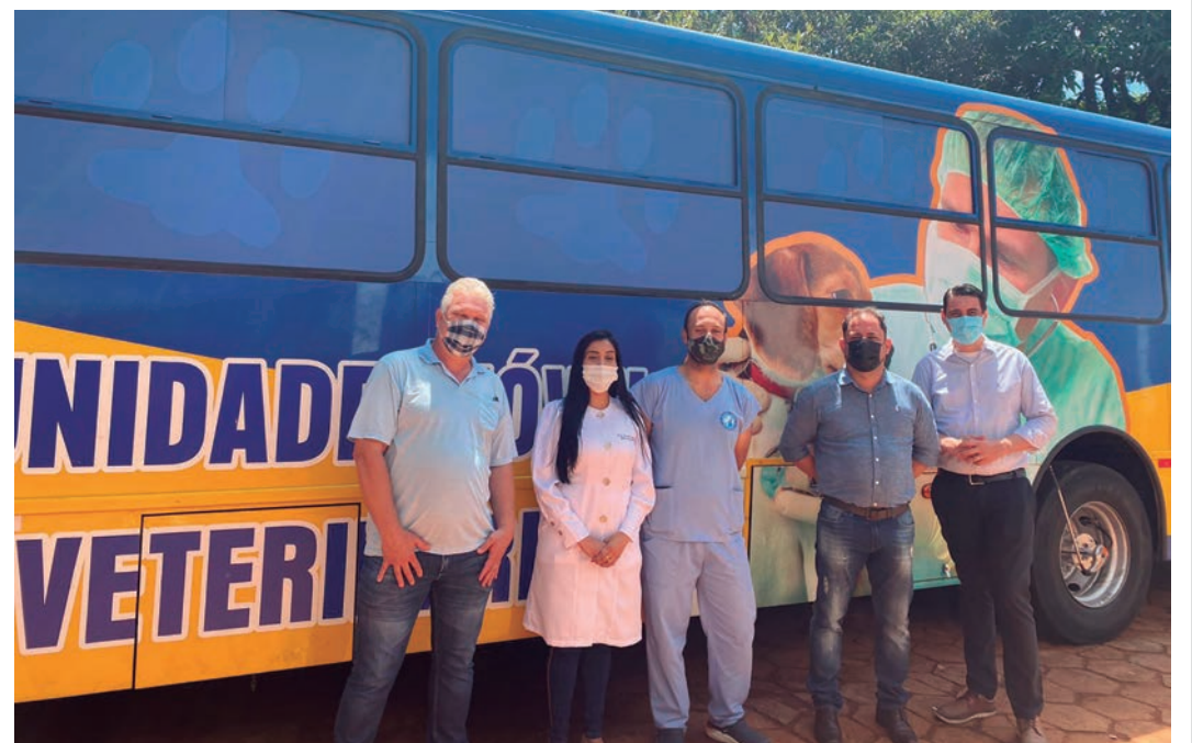
Unidade Móvel ficou estacionada ao lado do Centro Cívico Major Pires de Campos

“Eu tenho um carinho especial pelos animais e passei uma manhã muito gostosa acompanhando cada detalhe desta importante ação em nossa cidade. Parabéns a toda a equipe pelo trabalho!”, finalizou Santos.