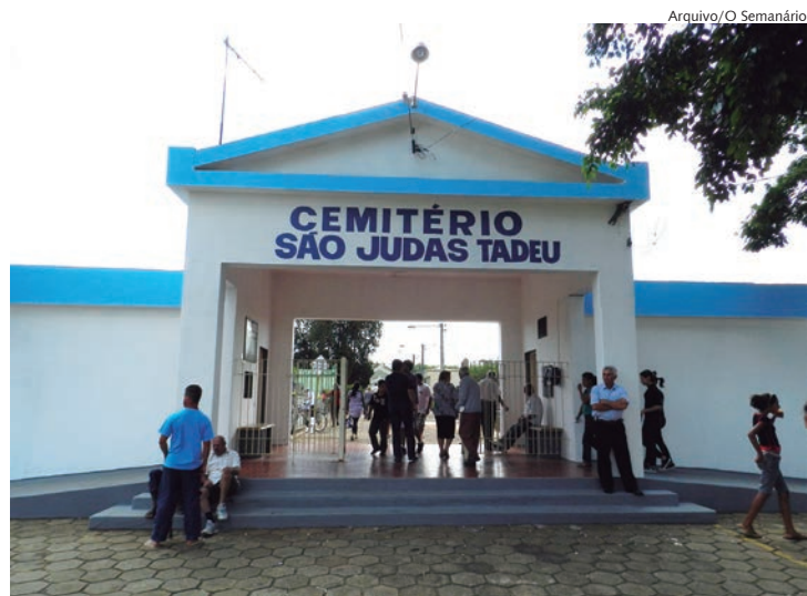
Cemitérios de Rafard, Capivari e Mombuca estarão abertos para receber visitantes e missas. Página 12