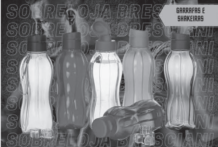
GARRAFAS E SHAKEIRAS