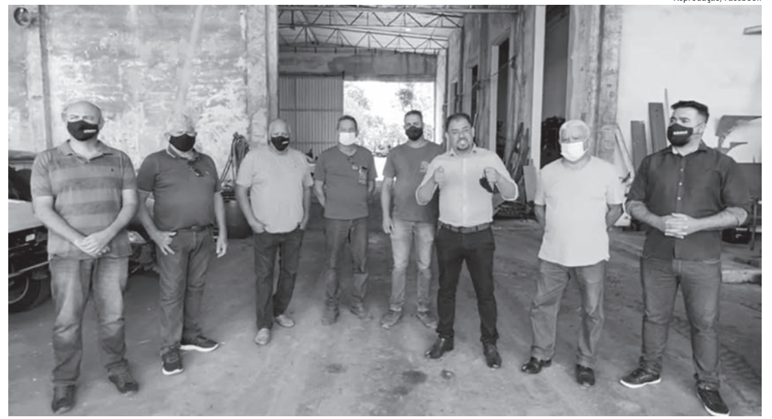
Anúncio foi feito em vídeo postado no Facebook; veículos já começaram a ser retirados

O Auto Socorro e Guincho Albatroz, mais conhecido como Guincho