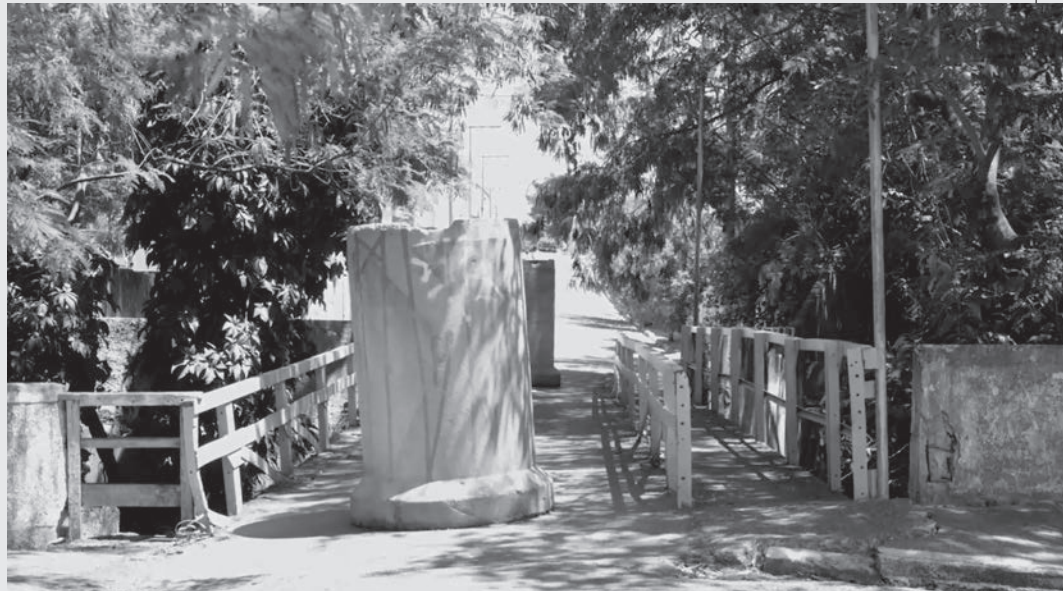
Local está interditado há mais de 10 anos; obra custará pouco mais de meio milhão de reais

A Prefeitura de Capivari anunciou uma nova obra na cidade, que deverá começar nos próximos dias. A ponte situada na rua Francisco Lembo, responsável por interligar o bairro Estação ao bairro Nova Aparecida, que estava com trânsito interditado a mais de 10 anos, será substituída para solucionar este problema. O custo da obra será de aproximadamente R$565 mil, sendo R$400 mil em recursos conquistados pelo deputado federal, Vanderlei Macris, com o restante do valor sendo investido em contrapartida pela prefeitura.