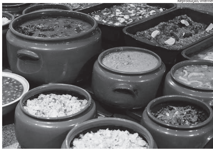
Evento será realizado na Fazenda São Bernardo, em Rafard