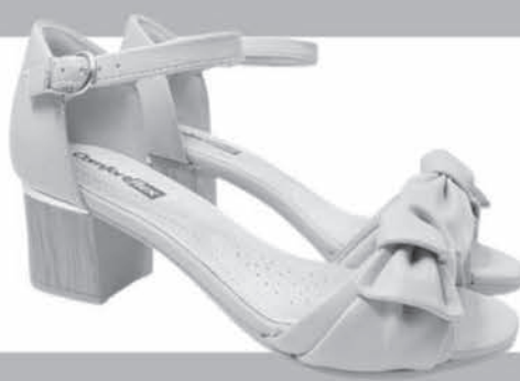
SANDÁLIA COMFORTFLEX DE R$15,99 ATÉ R$59,90