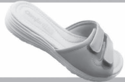
TAMANCO COMFORTFLEX DE R$15,99 ATÉ R$59,90