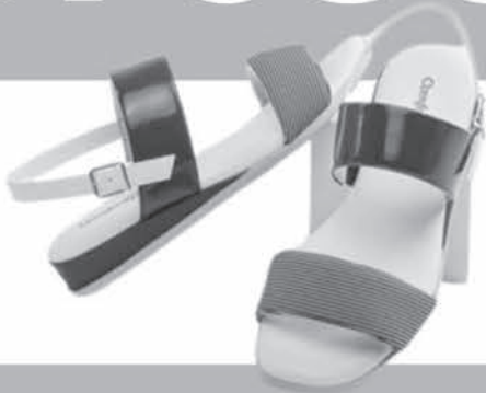
SANDÁLIA COMFORTFLEX DE R$15,99 ATÉ R$59,90