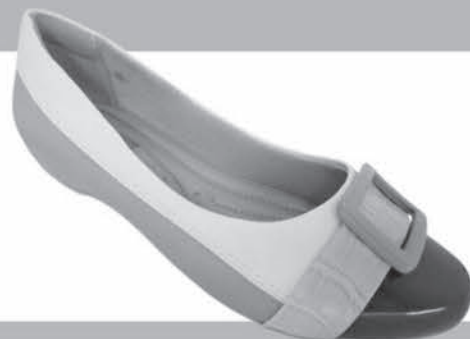
SAPATILHA COMFORTFLEX DE R$15,99 ATÉ R$59,90