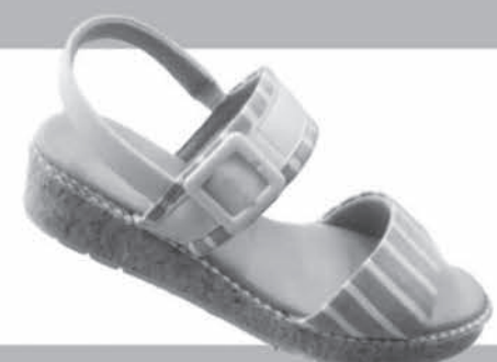
SANDÁLIA COMFORTFLEX DE R$15,99 ATÉ R$59,90