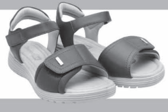
SANDÁLIA COMFORTFLEX DE R$15,99 ATÉ R$59,90