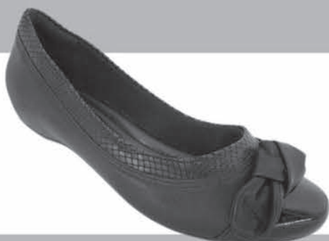
SAPATILHA COMFORTFLEX DE R$15,99 ATÉ R$59,90