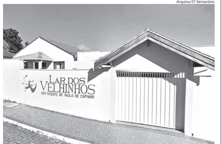
Bazar acontece na sede do Lar dos Velhinhos de Capivari

gurança dos idosos e higienização do espaço, é obrigatório o uso de máscara e a entrada será limitada à 6 pessoas por vez. O atendimento acontece através de senhas distribuídas.