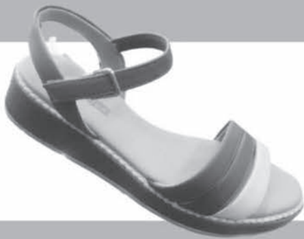
SANDÁLIA COMFORTFLEX DE R$15,99 ATÉ R$59,90