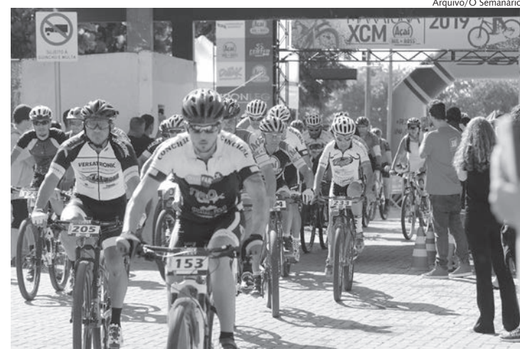
Largada e chegada acontecem no centro esportivo

O 6º Desafio MTB Maratona Açaí Mil & Ross já tem data para acontecer: no próximo dia 24 de abril. O evento de ciclismo, que já é tradição na cidade de Rafard, contará com 10 mil reais em premiações. As inscrições já estão abertas pelo site milerossmtb.com.br e segue até o próximo dia 20.