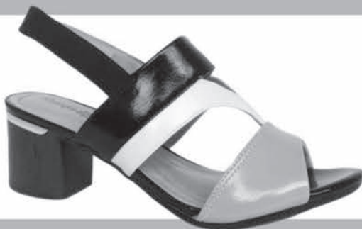
SANDÁLIA COMFORTFLEX DE R$15,99 ATÉ R$59,90