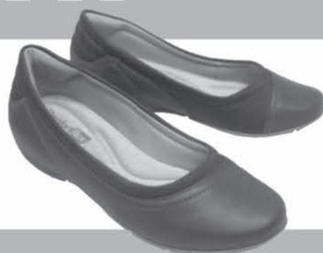
SAPATILHA COMFORTFLEX DE R$15,99 ATÉ R$59,90