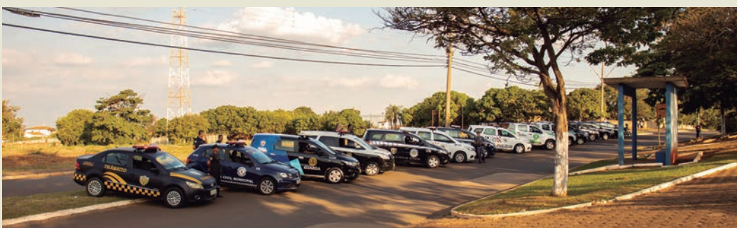
Viaturas da GCM, Polícia Civil, Polícia Militar e Bombeiros prestaram última homenagem