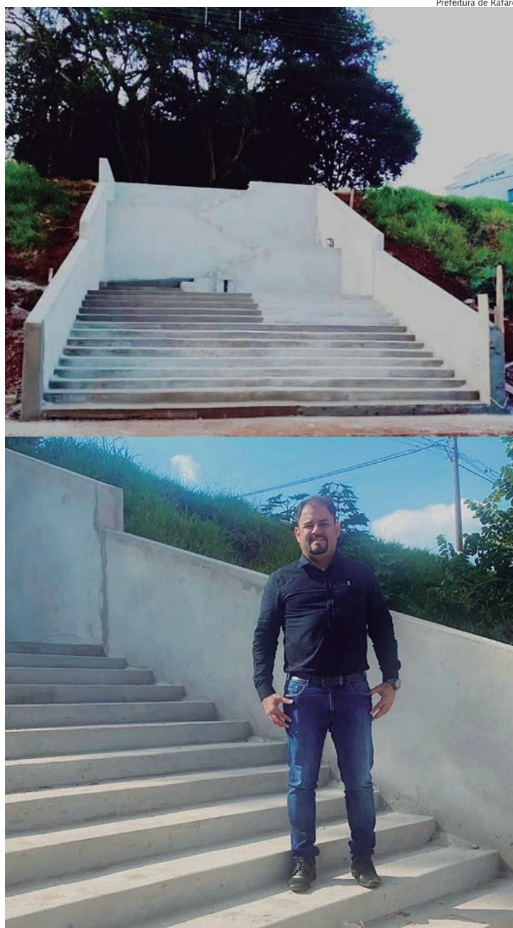
Prefeito Fabinho esteve no local nesta semana

“Agradeço a toda a equipe que se empenhou neste projeto. Nossa população será bastante beneficiada com mais essa obra em nossa cidade”, disse o prefeito Fabio Santos, que visitou o local na terça-feira (10).