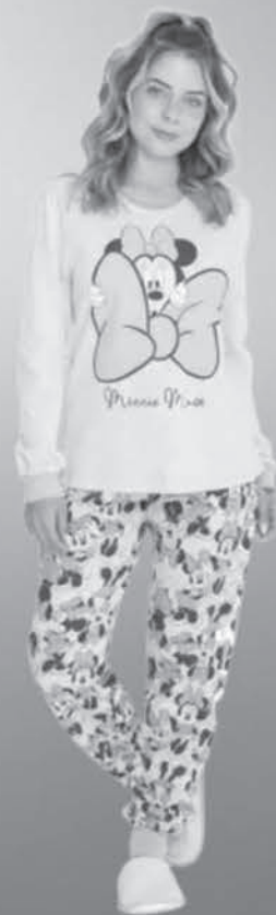
Pijama Adulto Feminino Evanilda