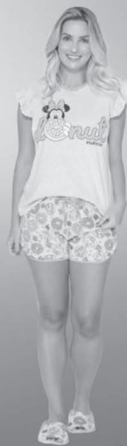
Pijama Adulto Feminino Evanilda