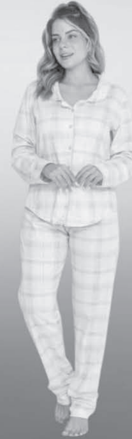
Pijama Adulto Feminino Evanilda

TAMBÉM ESTAMOS ATENDENDO COM DELIVERY, PEÇA PELO WHATSAPP (19) 98937-3474