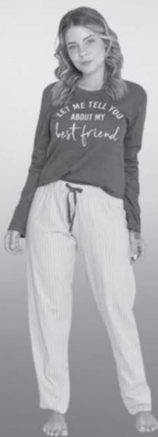
Pijama Adulto Feminino Evanilda