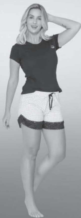
Pijama Adulto Feminino Evanilda