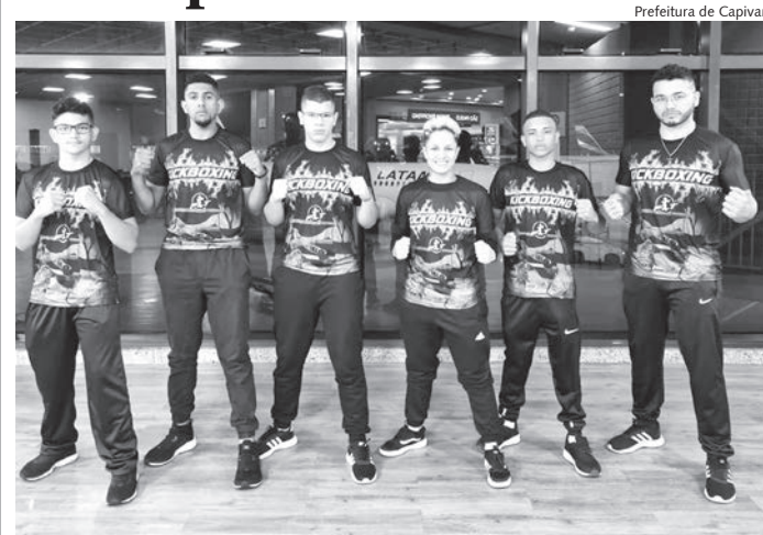
Competição aconteceu em Vitória/ES

Cinco atletas capivarianos foram para a cidade de Vitória, no Espírito Santo, no dia 15 de junho, para disputar o 31º Campeonato Brasileiro de Kickboxing. A competição aconteceu entre os dias 16 a 19 de junho e foi realizada pela Confederação Brasileira de Kickboxing.