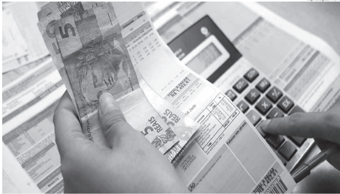
Aneel aprovou aumento de tarifas nas contas de energia

A alta de energia elétrica afeta não somente as famílias brasileiras, tirando o dinheiro da conta do supermercado, da farmácia, do açougue e da escola e transferindo para a conta de energia, mas afeta também os empresários que em maior ou menor grau, dependem da energia