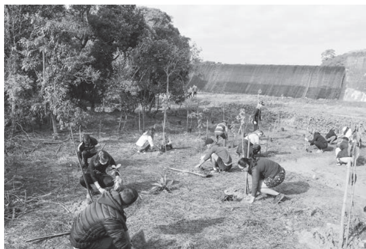
800 mudas de árvores nativas foram plantadas