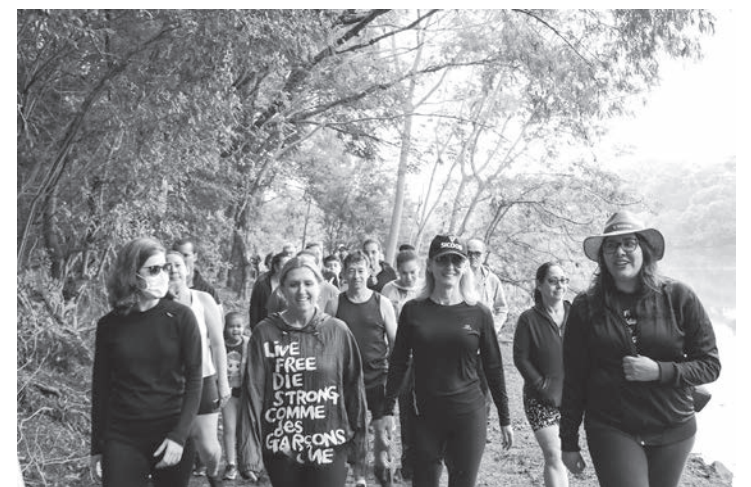
Cerca de 200 pessoas participaram da caminhada ecológica