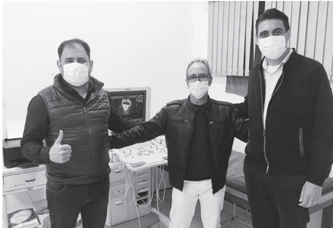
Aparelho está instalado na Unidade Básica de Saúde

Desde a aquisição do aparelho de ultrassom, a Unidade Básica de Saúde de Rafard está realizando mais atendimentos de exames de ultrassonografia na cidade.