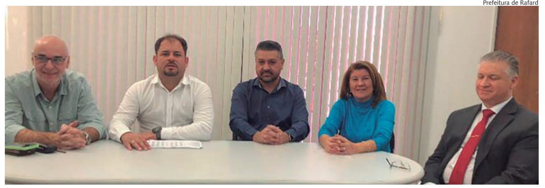
Últimos detalhes do pagamento do dissídio foram acertados na manhã de quinta-feira (23)