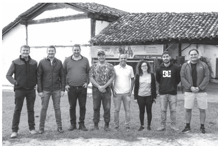
Prefeito Vitão Riccomini esteve presente