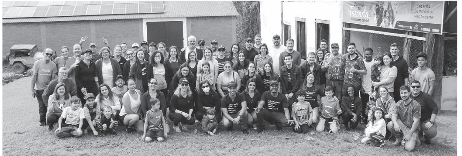
Participantes percorreram cerca de 5km à beira da represa Milhã

A iniciativa do Sicoob Cooplivre visa ressaltar a importância da preservação da mata ciliar e dos ecossistemas. Atualmente, a represa da Fazenda Milhã é responsável pelo abastecimento de água de 50% do município de Capivari.