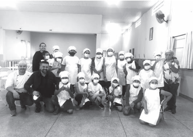
Capacitação aconteceu na sede da terceira idade

A Prefeitura de Rafard, através do Departamento de Assistência Social, realizou nos dias 2 e 9 de junho, na sede da Terceira Idade, o projeto Mini Chefe com crianças do grupo do serviço de convivência e fortalecimento de vínculos do CRAS Estação.