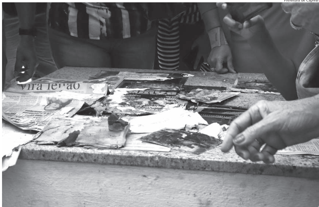
Arquivos descobertos na cápsula do tempo serão expostos de 11 a 22 de julho

Devido a pandemia, o monumento não pôde ser aberto no ano de 2020, quando completou exatos 20 anos, com a ação sendo feita dois anos mais tarde, no dia 22 de abril de 2022 em evento que contou com