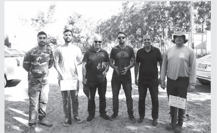
Parceria deve motivar novos projetos ambientais na cidade

A Secretaria de Desenvolvimento Urbano, através da Diretoria de Meio Ambiente, fez uma parceria com a empresa multinacional Cisco, para realizar um plantio de mudas, que ficará registrado como um marco de início dessa parceria.