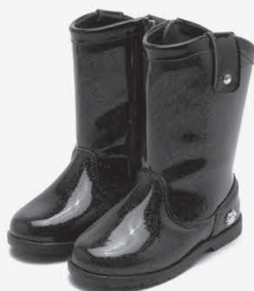
Bota infantil pé com pé Feminina