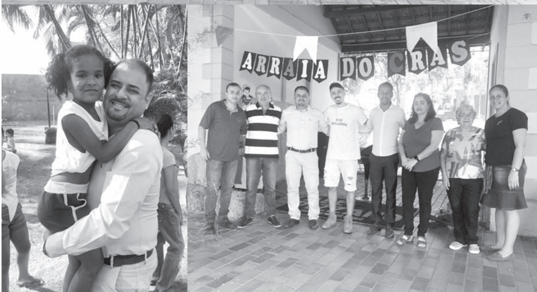
Centro de Referência de Assistência Social está localizado na antiga Estação

A Prefeitura de Rafard, através do CRAS Estação, realizou na quinta-feira (21), o tradicional Arraiá do Centro de Referência de Assistência Social. A festa contou com dança das crianças, barraças típicas, e música ao