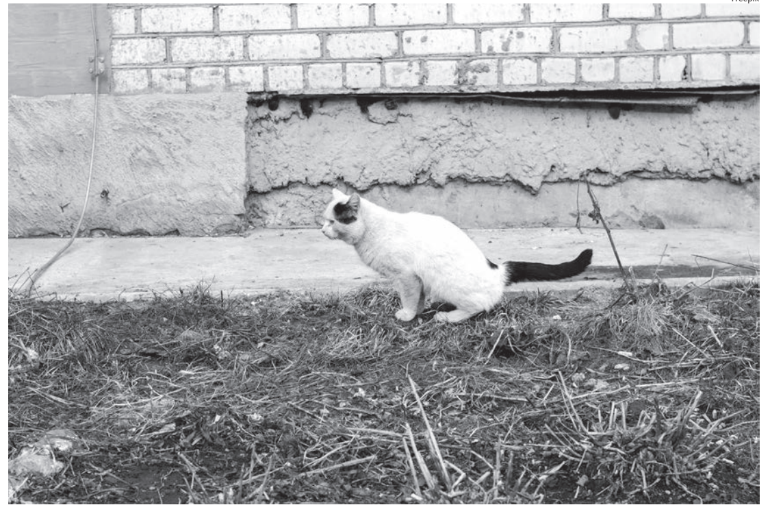
Segundo morador, gatos tem causado estragos, além da sujeira e mau cheiro; foto ilustrativa

artigo trata-se de responsabilidade objetiva, ou seja, não há necessidade de prova da culpa do proprietário do animal, basta que o animal cause um prejuízo que seu dono responde.