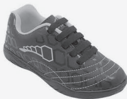
Chuteira infantil pé com pé Masculina