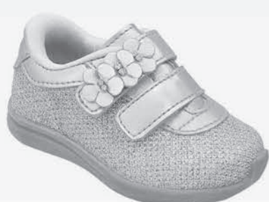
Tênis infantil pé com pé Feminino