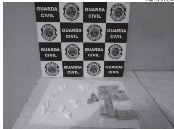
Entorpecentes apreendidos durante operação 'Lei e Ordem'

As informações são da Secretaria de Relações Públicas da Prefeitura de Capivari.