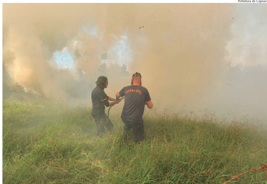
Defesa Civil tem combatido intensamente queimadas em Capivari

Evite jogar cigarros ou fósforos acesos nas margens de rodovias, acender fogueiras e evitar qual-