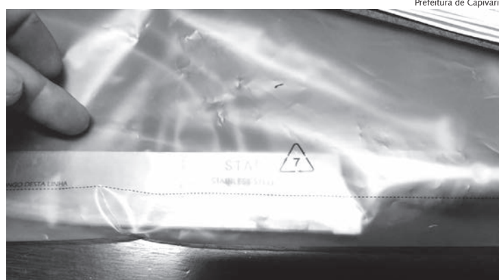
Faca utilizada durante a briga foi apreendida pela GCM

O homem que havia sido ferido tem 40 anos de idade e estava lúcido, contando o que teria acontecido aos agentes assim que chegaram ao local. Durante o relato, ele informou que se desentendeu com um homem de 35 anos em um bar, a discussão escalou até uma alteração, quando o suspeito usou uma faca que estava em sua posse para golpear a vítima no tórax, que por sua vez, fugiu pela rua pedindo socorro.