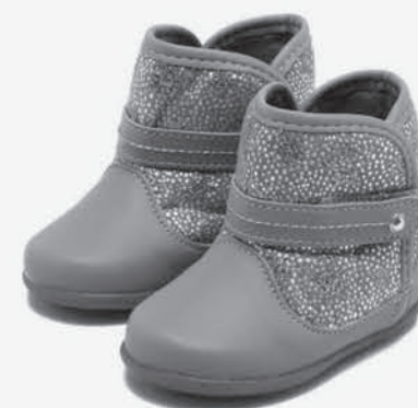
Bota infantil pé com pé Feminina