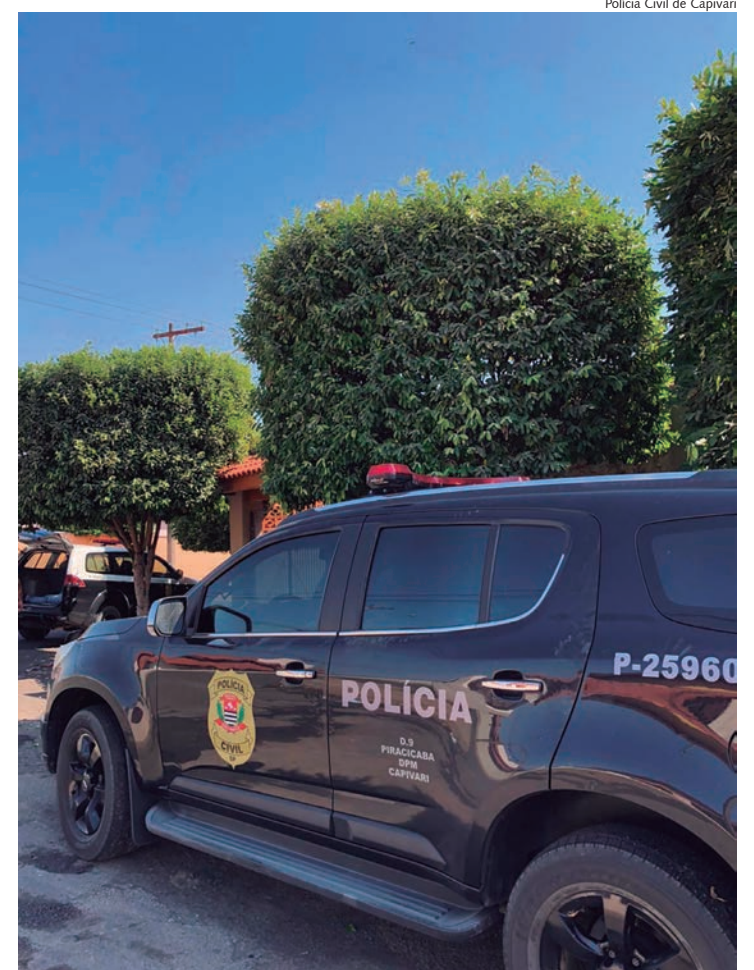
Semana agitada para a Polícia Civil de Capivari

É possível fazer denúncia anônima nos telefones: Disque Denúncia Nacional 100; em caso de emergência 190; Conselho Tutelar (19) 3492-3025 ou 3492-6422; Guarda Civil 153 (fora do horário do Conselho Tutelar); CREAS (19) 3492-5805; Delegacia de Defesa da Mulher (19) 3491-4181 ou 3491-2563; também pelo WhatsApp