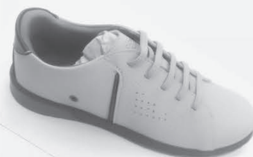
Tênis casual kids pé com pé Masculino