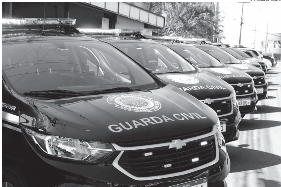
Guarda Civil Municipal tem atuado fortemente no combate ao crime em Capivari

Os oficiais Guarda Civil de Capivari, durante patrulhamento preventivo no bairro Morada do Sol, na noite de sexta-feira (22), efetuaram a prisão de uma mulher de 54 anos, que constava como procurada pela justiça nos sistemas policiais. O atendimento a