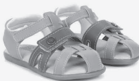
Papete infantil pé com pé Masculina