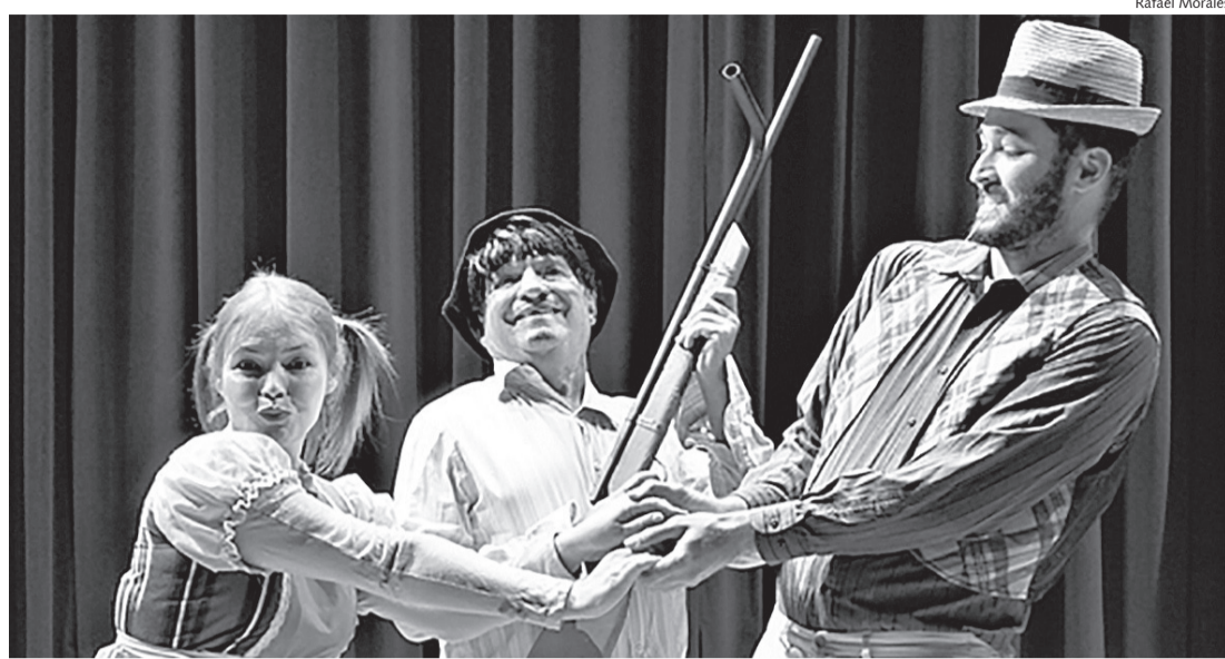
Artistas se apresentam em duas sessões no Centro Cultural Júlio Henrique Raffard