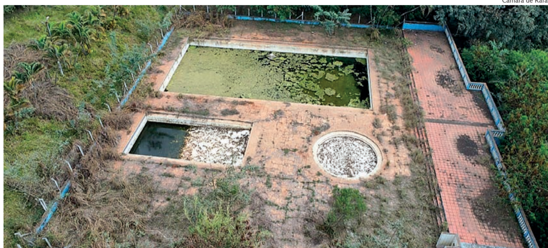
Câmara de Rafard

Lei Paulo Gustavo Juntos para a cultura resistir