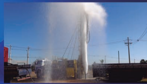
MELHOR ÍNDICE DE APROVAÇÃO