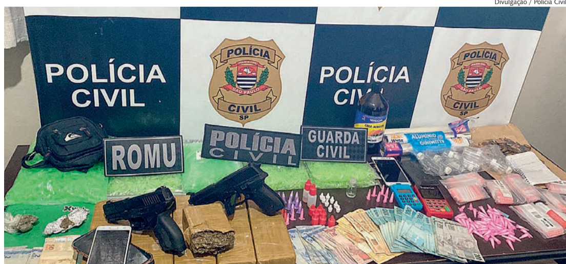
Grande quantidade de entorpecentes, simulacros de arma de fogo e dinheiro foram apreendidos pela Polícia Civil

Um terceiro indivíduo, que também estava sendo investigado, foi autuado em flagrante, em sua residência, no bairro Flamboyant. No local, os policiais encontraram 'tijolos' de maconha, cocaína, materiais para acondicionar lança-perfume e um simulacro de arma de fogo.