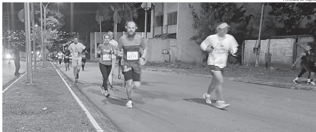
Largada e chegada será na rua Vinicius de Moraes em frente ao parque ecológico

A largada e chegada da Luau Run será na rua Vinicius de Moraes, no bairro Morada do Sol, em frente a entrada do Parque Ecológico; em seguida o trajeto levará os competidores até rua Érico Veríssimo e depois à avenida Pio XII, em que os participantes irão até a esquina com a rua Pedro Stucchi, antes de fazer o caminho inverso, rumo a linha de chegada.