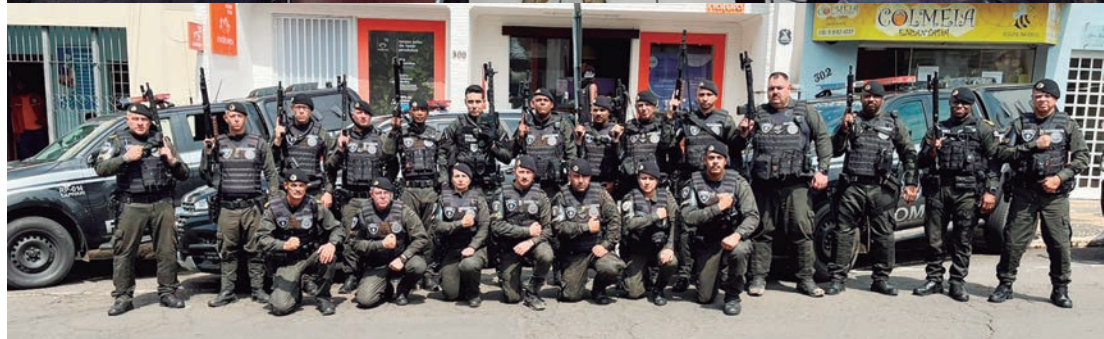
Operação "For Honor" contou com a participação da Polícia Civil de Capivari com apoio da GCM

consumado. A operação segue em busca de outros membros da organização criminosa.