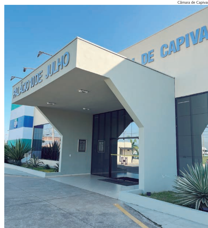
Após quase 10 anos, Câmara de Capivari realiza novo concurso

São nove os cargos: auxiliar de serviços diversos, motorista, técnico de informática, contador, escriturário, jornalista, oficial de comunicação, oficial legislativo e publicitário/designer. Dentre eles, sete contam com vagas disponíveis: auxiliar de serviços diversos, técnico de informática, contador, escriturário, jornalista, oficial legislativo e publicitário/designer. Os demais entram para