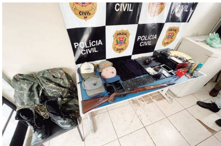
Objetos e armas apreendidos durante operação

fica "pela honra". Nome destinado à operação policial como forma de homenagear Guardas Civis Municipais de Capivari que corajosamente entraram em confronto com criminosos fortemente armados na área rural do município.