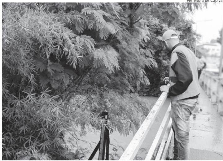
Rio Capivari chegou a bater a marca de 1,60m

A Defesa Civil realizou monitoramento em todos os bairros da cidade, onde foi observado uma calçada que sofreu avarias, no bairro Moreto, além de um muro que desabou na avenida José Annicchino. Para evitar acidentes, um caminhão autobomba foi designado ainda na noite do domingo, para realizar a