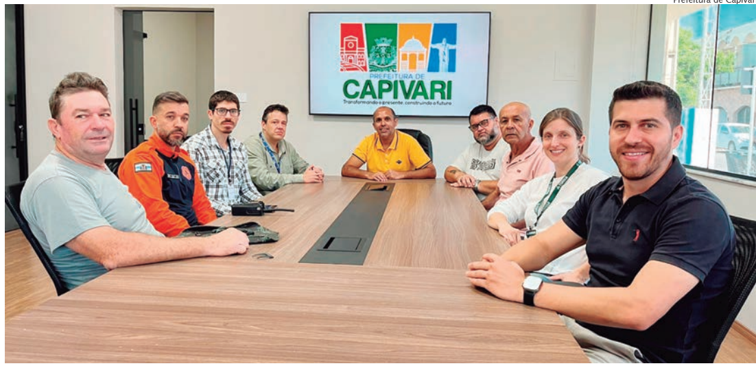
Rio Capivari e córregos de Capivari serão beneficiados com desassoreamento

Segundo o chefe do Executivo rafardense, a homologação do desassoreamento já foi oficialmente publicada, e agora a cidade aguarda a chegada dos equipamentos necessários para dar início ao processo.