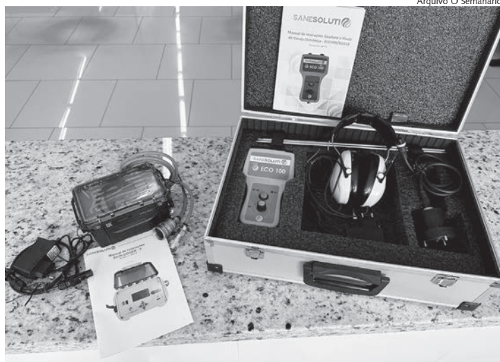
Geofone e Datalogger foram comprados pela autarquia

Já o Datalogger, tem a finalidade de monitorar e registrar as pressões de rede de água. Com