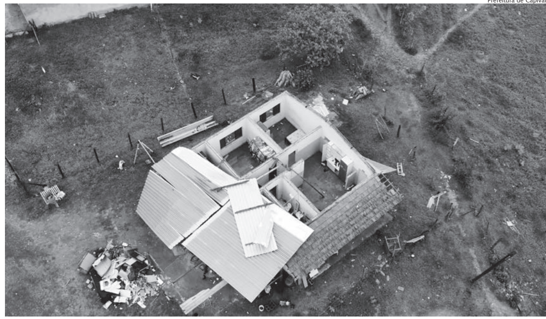
Casas foram destelhadas no bairro Bonagúrio, em Capivari; 19 pessoas ficaram desalojadas

A Defesa Civil do Estado de São Paulo emitiu alerta meteorológico, válido para esta quinta-feira (12) até sábado (14), informando a passagem de uma frente fria, mesmo que afastada do continente, que causará fortes precipitações na