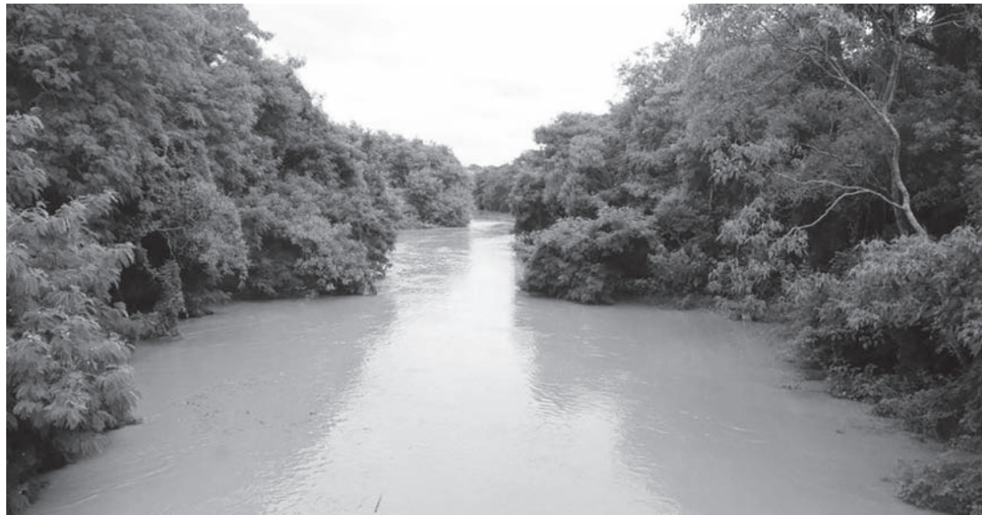
Nível do Rio Capivari chegou a 2,74 na quarta-feira, 11, e começou a baixar na parte da tarde