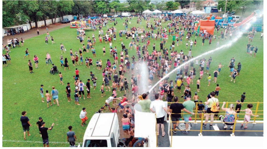
Evento contou com a tradicional "chuva de prata" no final, fazendo a alegria da criançada

A Prefeitura de Rafard, com apoio de comércios e empresas da região, realizou no feriado de quinta-feira, 12 de outubro, a tradicional Festa das Crianças. Segundo o governo municipal, mais