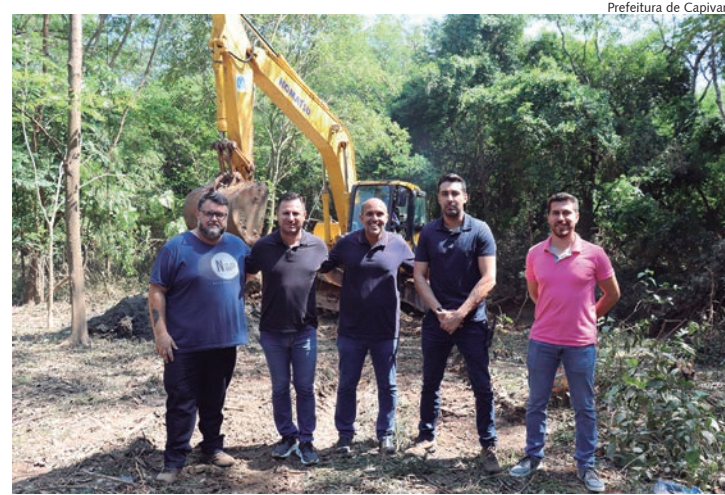
Equipe do governo municipal acompanhou início das obras

Para dar andamento neste projeto, foi necessário o licenciamento do Rio Capivari e afluentes, exigindo estudos que tratavam sobre quantidade de árvores retiradas, quantidade de lodo que seria retirado e onde seria deixado, estudo sobre compensação ambiental e muitas outras