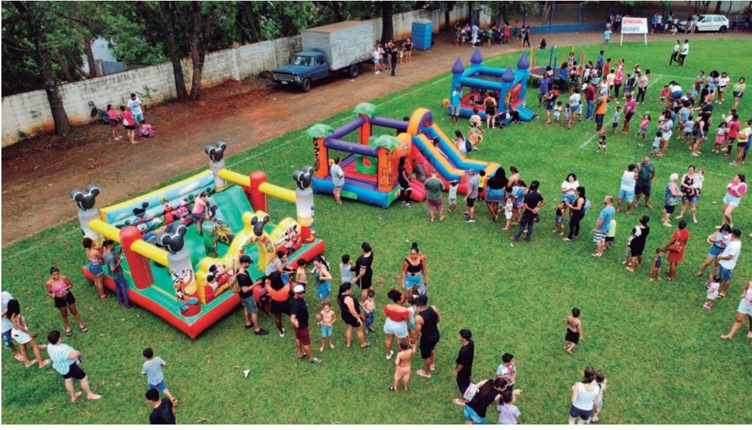
Brinquedos infláveis foram distribuídos nos espaços do campo Jair Forti