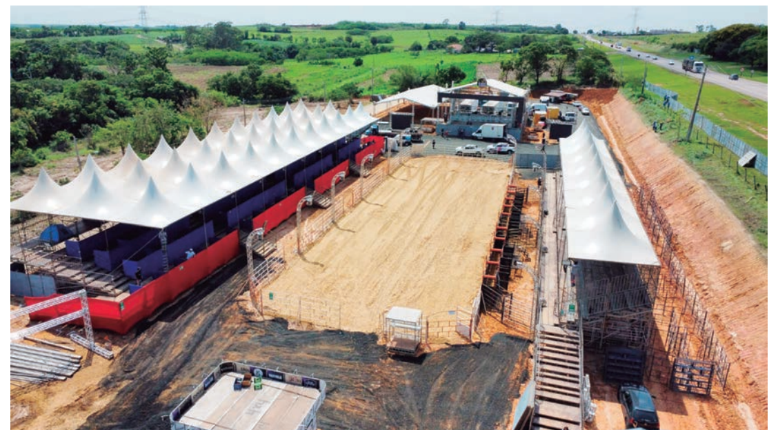
Cerca de 15 mil pessoas são esperadas nos três dias de festa em Capivari