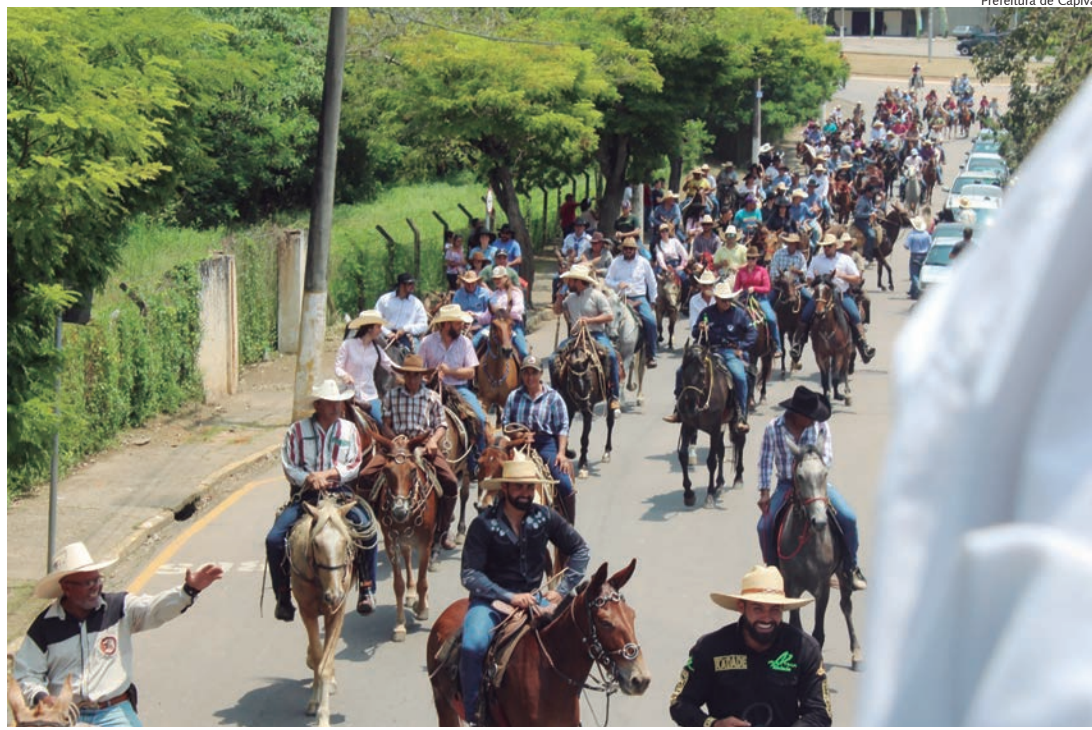
Tradicional desfile realizado pelo Clube dos Cavaleiros tomou as ruas de Capivari

“Foi um desfile ótimo, saiu tudo dentro do esperado, num ambiente alegre e descontraído, com muitas famílias e crianças participando ao longo de todo o percurso. E mesmo quem não tem cavalo ou charrete saiu às ruas para ver os animais passarem. Acho que a semana da 1ª Expo