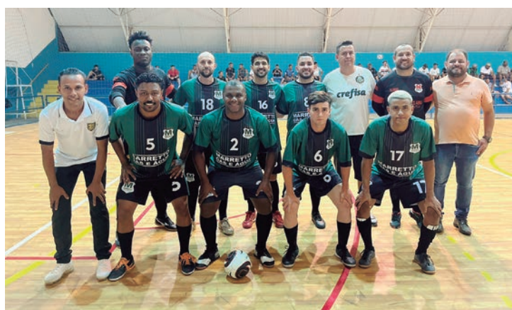
Equipe Marretto Gás e Água marcou 11 gols logo na primeira rodada