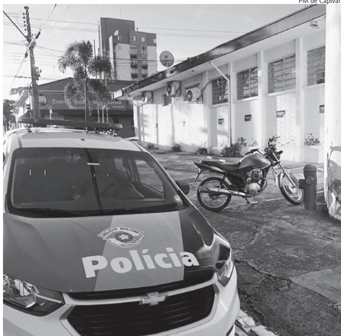
Moto foi levada para a delegacia e devolvida à proprietária