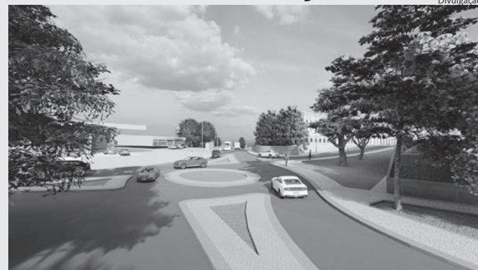
Projeto da nova rotatória que será implantada no bairro