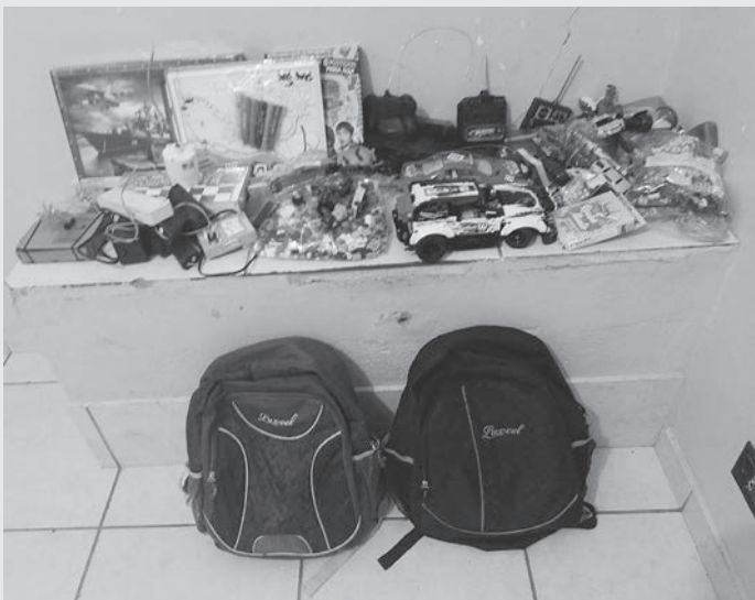
Objetos furtados foram recuperados pela GCM de Capivari

A Guarda Civil de Capivari prendeu na madrugada da quarta-feira, 1, um homem por furto. A corporação também apreendeu um menor de idade pela participação na ação. O caso aconteceu no bairro Residencial Santa Rita.