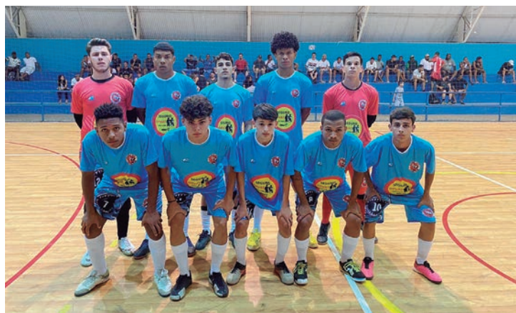
Beira Rio FC levou a melhor sobre o adversário, anotando 8 gols