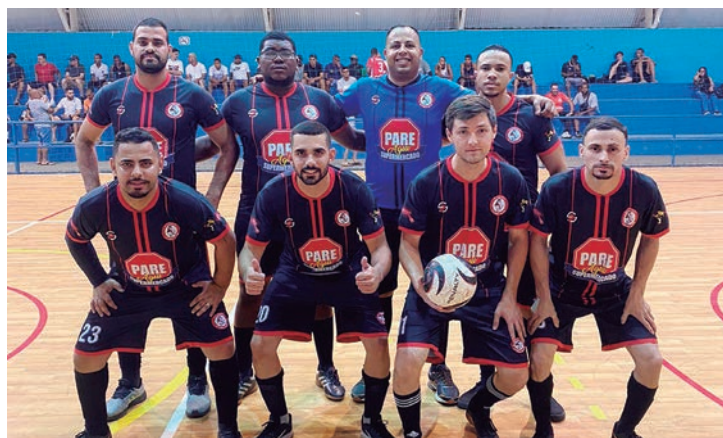
Equipe Capi FC estreou com derrota, mas marcou 5 gols