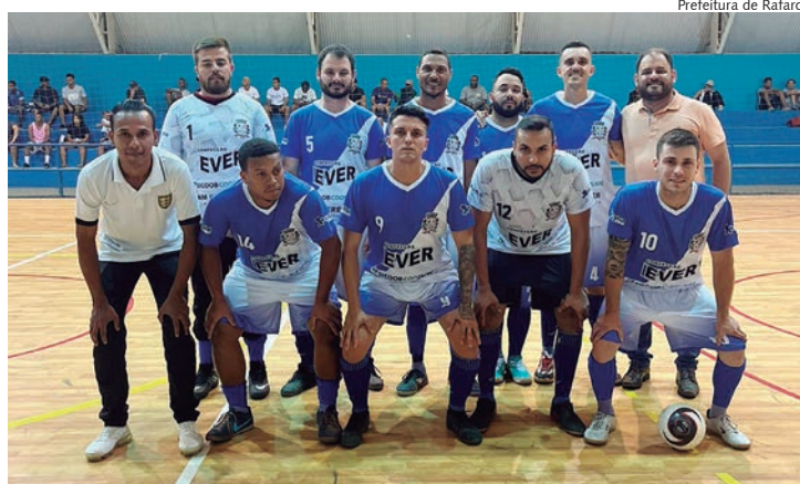
Equipe do Departamento de Cultura, Esporte e Turismo de Rafard