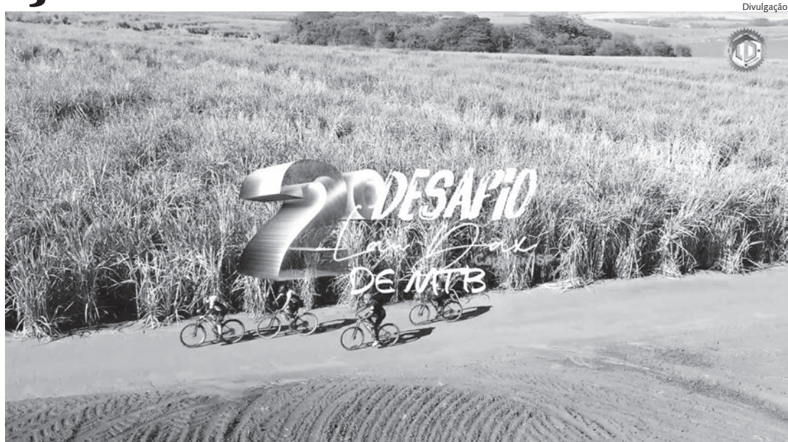
Provas serão disputadas em percursos de 19km (Fun), 50,8km (Sport) e 63,82km (Pro)

O percurso desafiador abrangerá trilhas, estradas de terra e asfalto, apresentando obstáculos naturais como subidas, que serão superados pelos atletas sem qualquer auxílio externo.