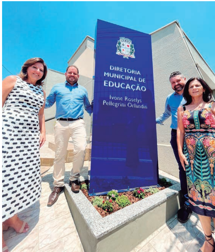
Prefeitura de Rafard