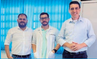
Prefeitura de Rafard

Profissional irá reforçar os serviços de Atenção Básica, realizando atendimentos essenciais à população e visitas domiciliares.