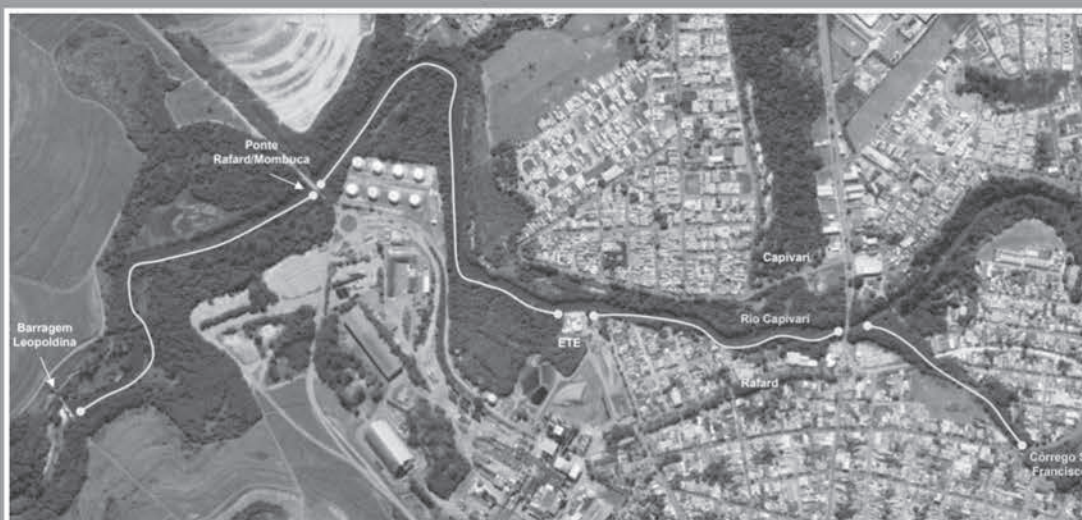
Imagem Google atual (2023) com a demarcação geral dos trechos a serem desassoreados compreendendo o Córrego São Francisco e o Rio Capivari

Licenciamento e Anuências: O DAEE emite a Outorga ou dispensa de Outorga; A CETESB - Companhia Ambiental do Estado de São Paulo, emite as devidas licenças e autorizações para Intervenção em APP e Supressão de Indivíduos arbóreos.