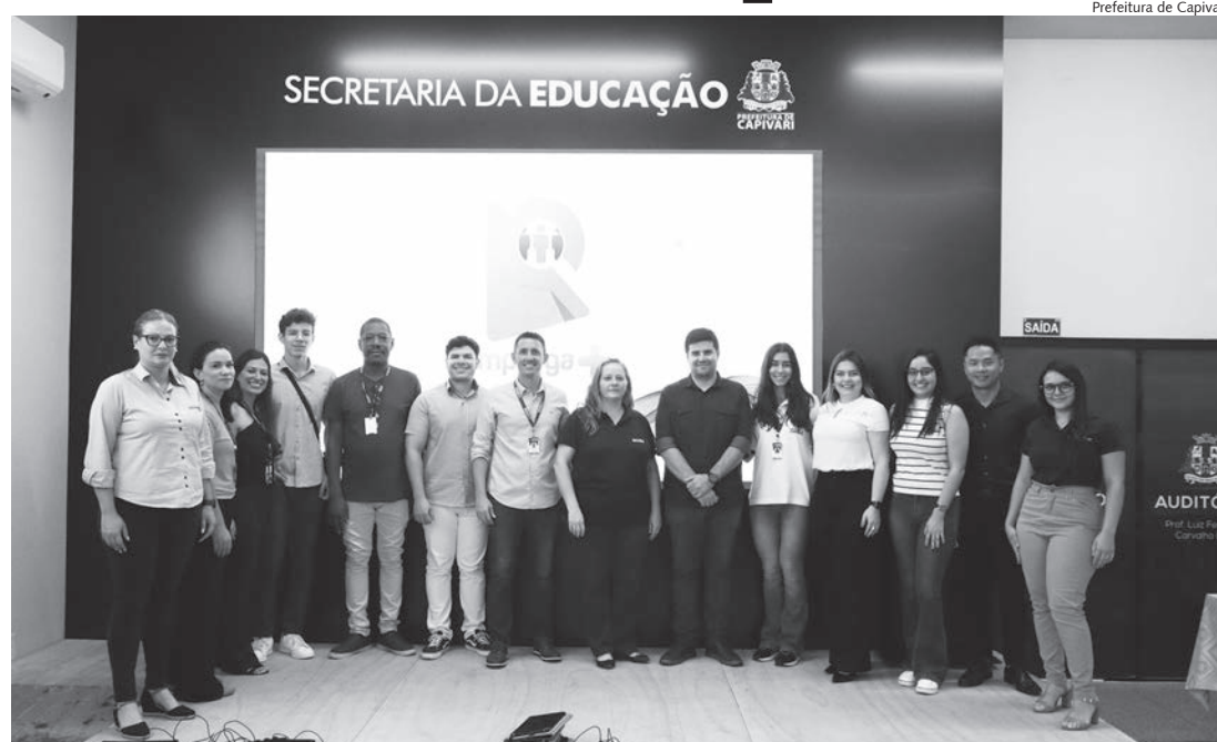
Aplicativo foi apresentado à representantes das empresas no auditório da Secretaria da Educação

A nova aplicação foi anunciada pelo prefeito de Capivari, Vitão Riccomini, durante a primeira edição do “Conecta Capivari Empresarial” que aconteceu no mês de junho. Na ocasião, o prefeito deu uma prévia aos participantes do evento sobre uma plataforma de intermediação que reuniria currículos de candidatas à diferentes