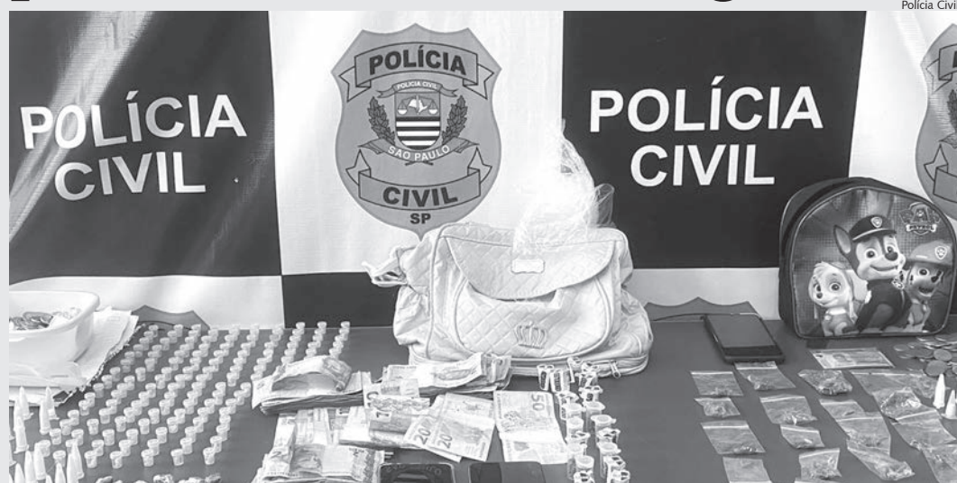
Entorpetecentes e dinheiro proveniente do tráfico de drogas apreendidos pela polícia

Uma ação policial comandada pela Polícia Civil de Capivari, com apoio da Guarda Civil Municipal, para cumprimento à mandados de busca e apreensão domiciliar na cidade, resultou na apreensão de porções de maconha, cocaína, crack, substância SKUNK e mais de R$ 800,00 em dinheiro, entre outros materiais.