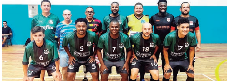
Prefeitura de Rafard

Oito equipes disputam ponto a ponto na competição, que é realizada no ginásio Olavo de Campos Borghesi.