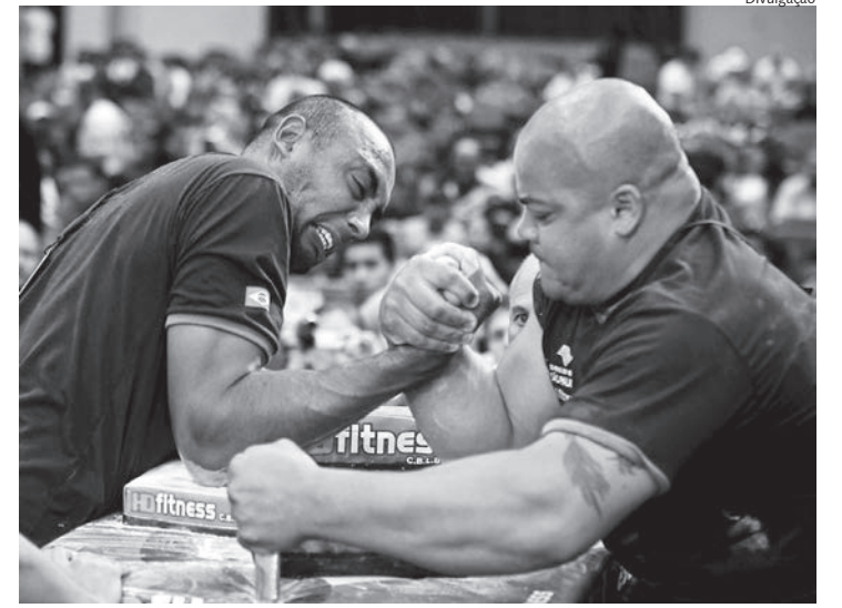
Atletas disputam técnica e força em busca de uma vaga no Panamericano de Luta de Braço

As inscrições para os interessados em participar seguem abertas até o dia 24 de novembro pelo e-mail: moreiraforcasfisiaca@hotmail.com .