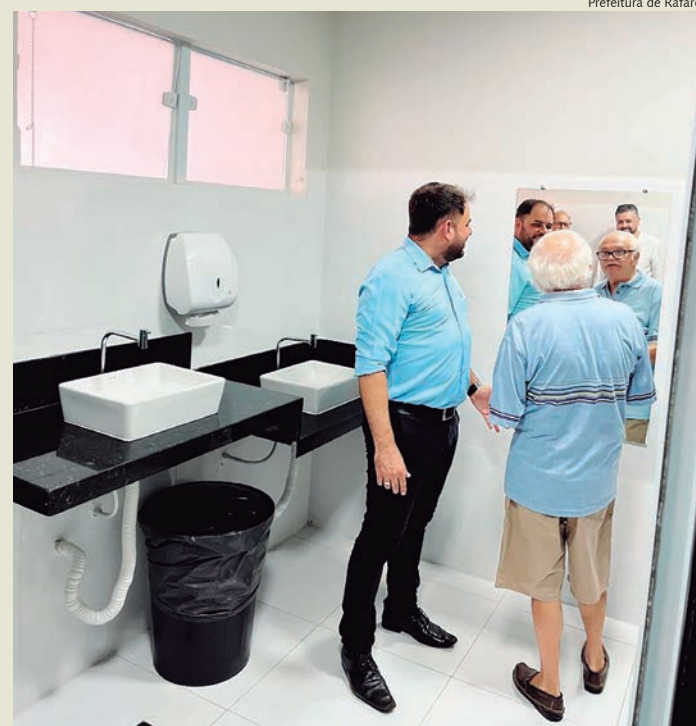
Novos banheiros já estão em funcionamento na UBS

Na manhã desta terça-feira, 14, a Prefeitura de Rafard celebrou a inauguração dos novos banheiros da Unidade Básica de Saúde (UBS). Os banheiros, agora totalmente reformados, receberam melhorias significativas para torná-los mais acessíveis e acolhedores, refletindo o compromisso da administração com o conforto e bem-estar dos cidadãos.