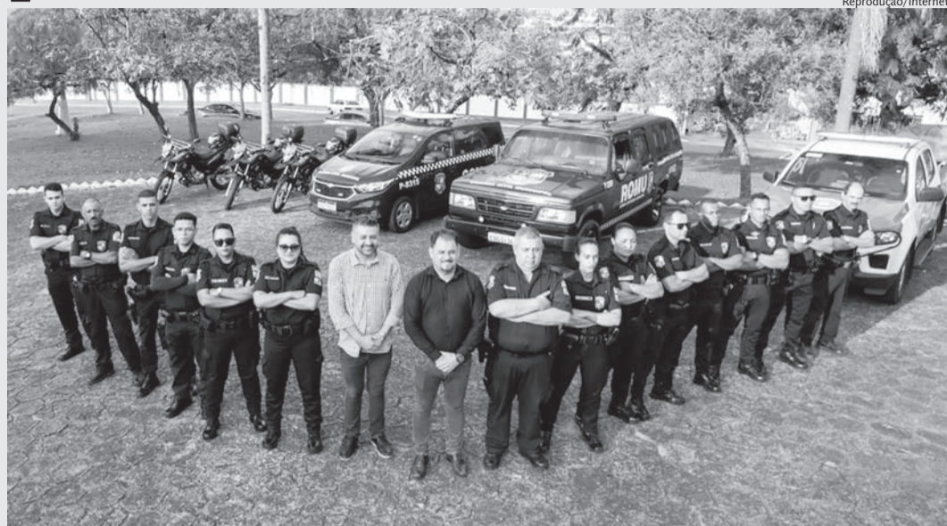
Equipe da Guarda Civil de Rafard trabalha para manter a paz e a ordem na cidade