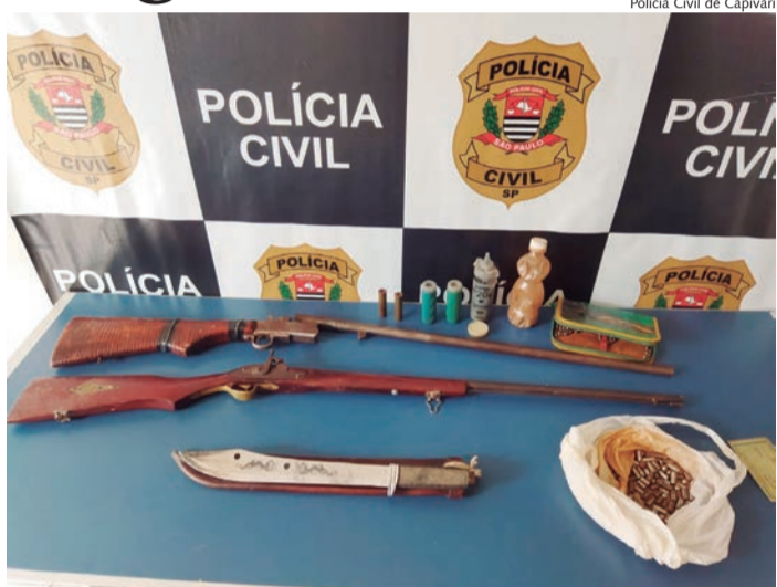
Armas e munições apreendidas com homem que foi preso