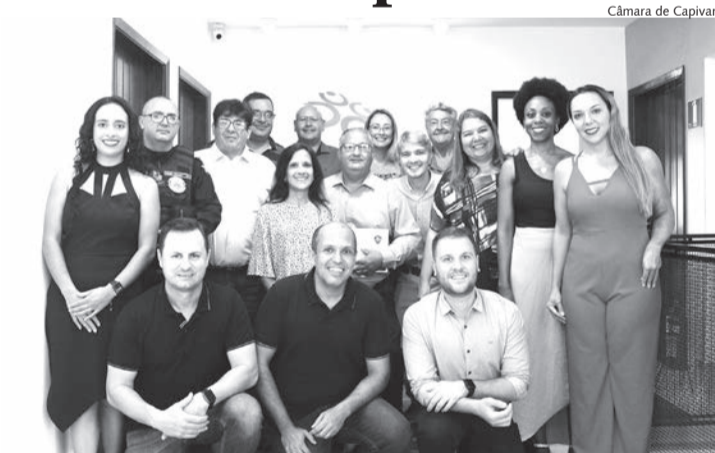
Cerimônia de posse aconteceu na última segunda-feira, 15