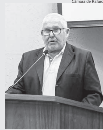
Câmara de Rafard