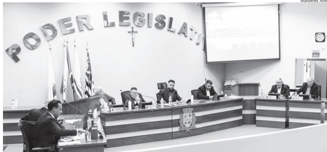
Primeira sessão ordinária de 2024 contou com a presença de 8 vereadores