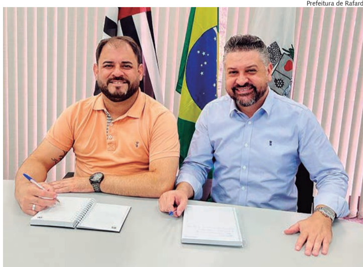
Prefeito Fabinho Santos e vice Wagner Bragalda anunciaram expansão dos serviços na Unidade Básica de Saúde

O prefeito de Rafard, Fabio Santos, e o vice-prefeito, Wagner Bragalda, anunciaram no sábado (3), uma significativa expansão nos serviços de saúde oferecidos à comunidade. A partir de agora, a Unidade Básica de Saúde (UBS) disponibilizará serviços de raio X também aos finais de semana, como parte dos esforços contínuos para aprimorar a assistência à saúde local.