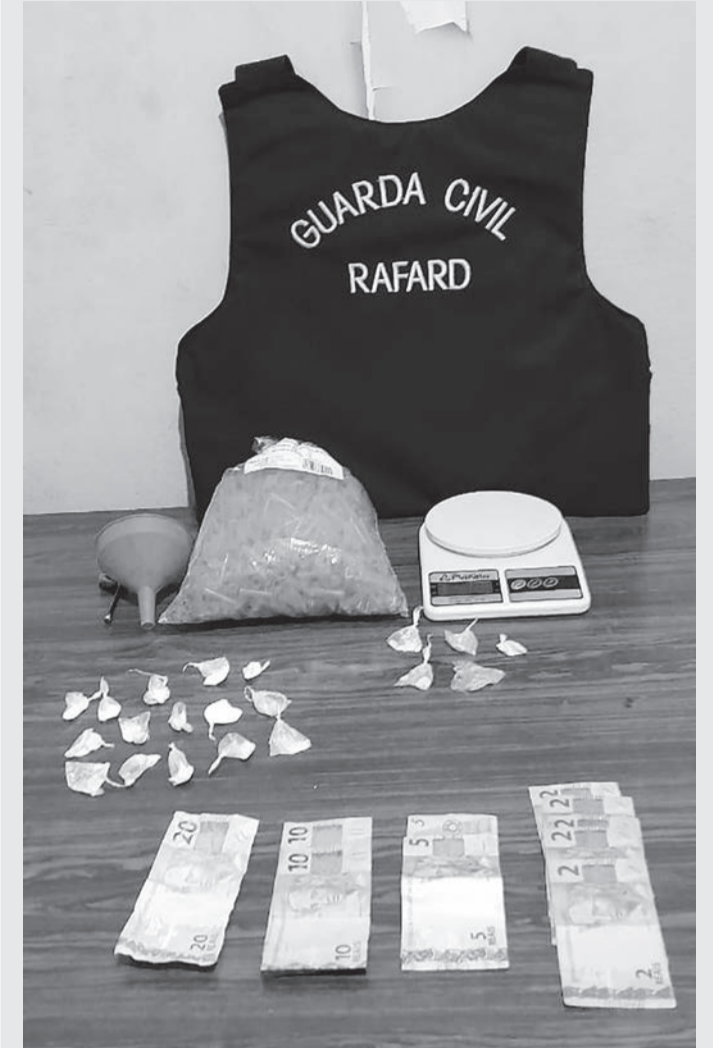
Drogas, dinheiro e utensílios utilizados para o embalo de entorpecentes foram apreendidos em ação da GCM