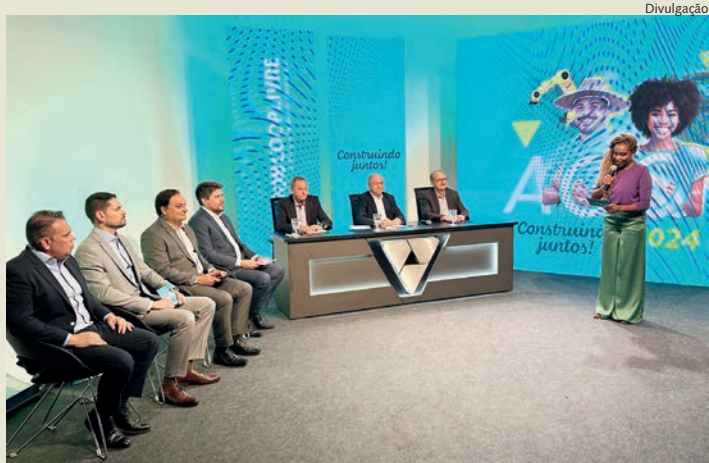
Aplicativo foi apresentado no plenário do Legislativo

O evento aconteceu de maneira digital e foi transmitido ao vivo pelo YouTube, com as votações realizadas pelo aplicativo Sicoob Moob. Foram colocados em votação, na Assembleia Geral Extraordinária, a prestação de contas dos órgãos de administração referente ao exercício findo de 2023, a destinação das sobras apuradas e fórmula de cálculo de rateio, a eleição dos membros do Conselho de Administração, de acordo com as condições estabelecidas no Estatuto Social e no Regulamento Eleitoral, a eleição dos membros do Conselho