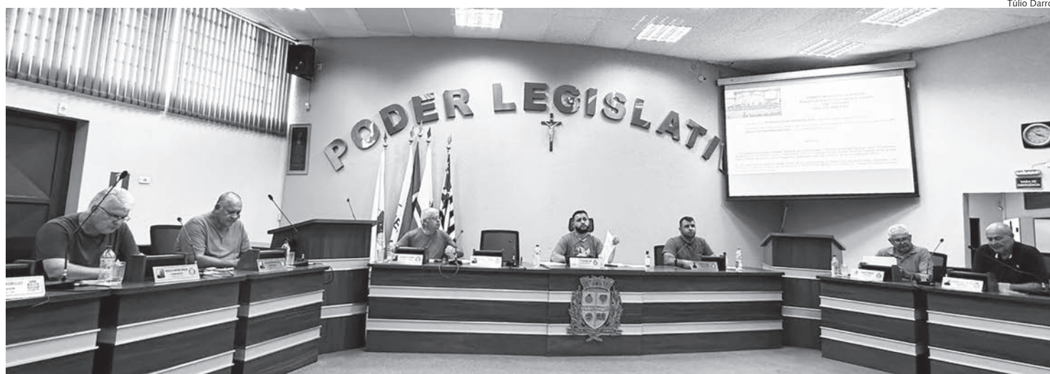
Projetos de Lei Complementar foram aprovados por unanimidade em 3 sessões extraordinárias realizadas na quarta-feira (28)

As deliberações focaram em dois projetos de lei complementar, ambos aprovados por unanimidade nas duas rodadas de votação e previstos para entrar em vigor a partir de março.