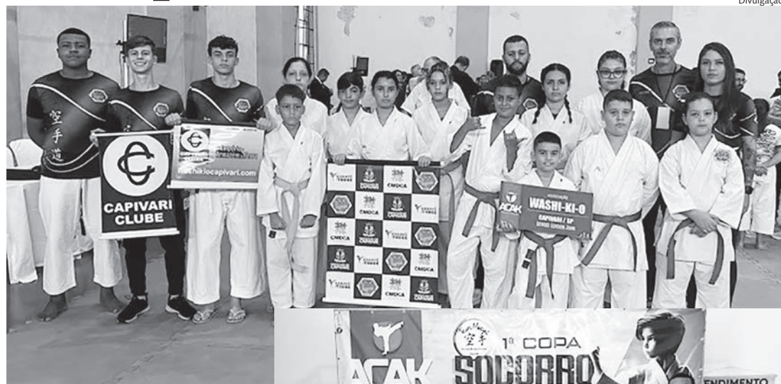
Caracatecas conquistaram 24 medalhas e o 4º lugar na classificação geral

No último domingo (25), atletas da Washi-Ki-O participaram da 1ª Etapa do Circuito ACAK 2023, realizada no Ginásio Municipal de Esportes Nego Bonetti, em Socorro. A 1ª Copa Socorro de Karatê – Circuito das Águas abriu o circuito 2024 de competições da ACAK.