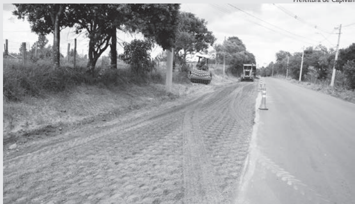
Serão mais de 3 mil metros quadrados de novo asfalto

As ciclofaixas terão 2,50 metros de largura ao longo de toda a via, servindo para que ciclistas do município possam circular com segurança. Uma nova pavimentação também faz parte do projeto de revitalização da região, que teve início em