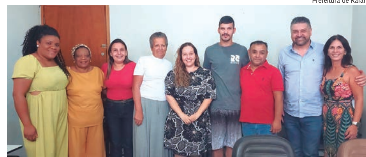
Encontro aconteceu no gabinete da Prefeitura de Rafard

O encontro reuniu a mesa diretiva do Conselho de Cultura, autoridades locais e membros da comunidade, todos unidos pelo propósito comum de fortalecer a cultura em Rafard. A cerimônia não apenas formalizou a posse dos conselheiros, mas também