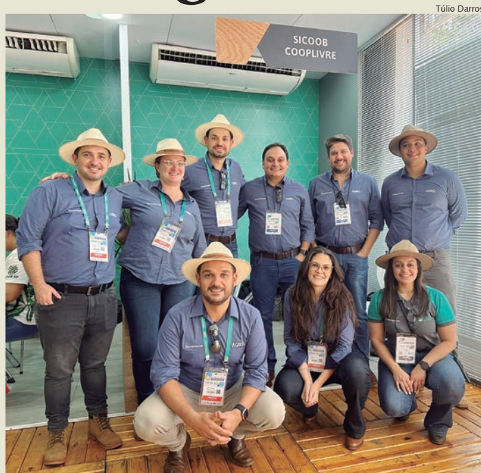
Diretores e equipe Agro do SicoobCooplivre presentes na Agrishow 2024, na última terça-feira, 30 de abril