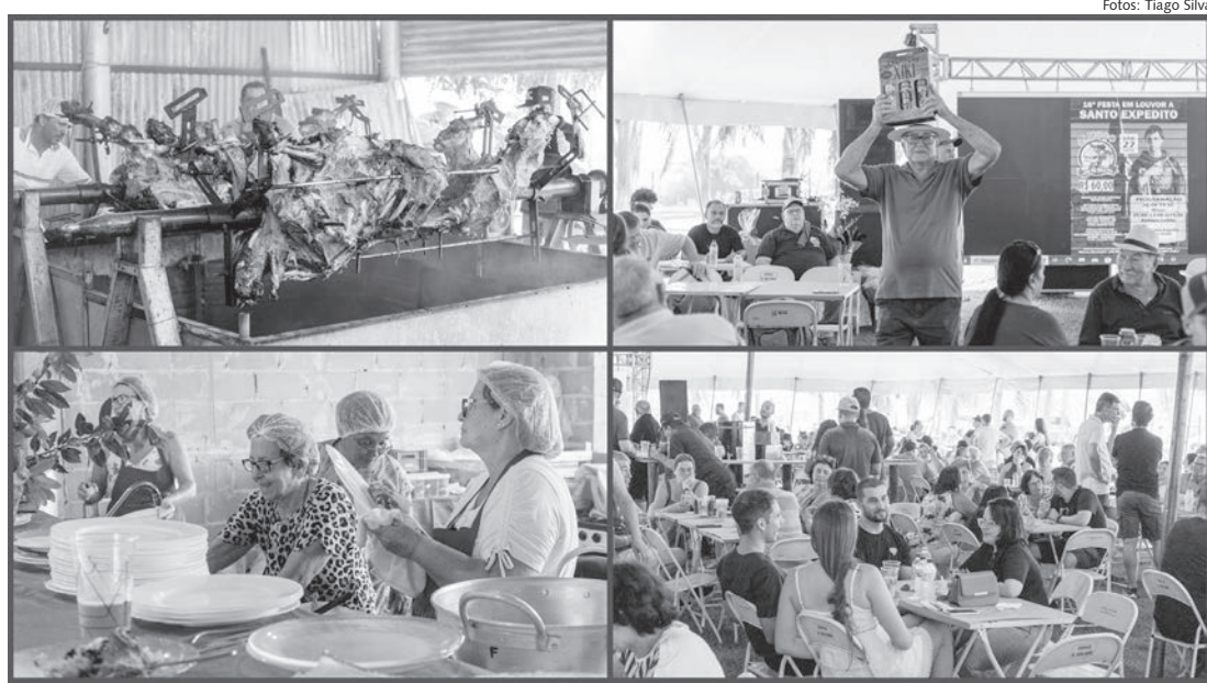
Tradicional festa reuniu centenas de pessoas no Km 58 da SP 101