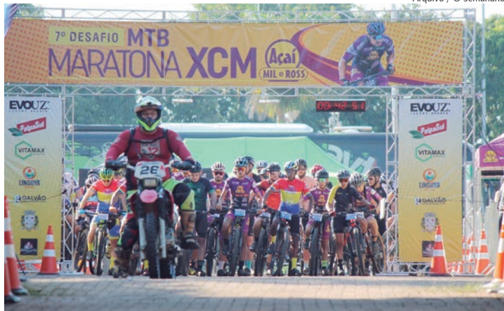
Largada e chegada da prova acontece no centro esportivo

O município de Rafard, reconhecido por suas paisagens naturais e percursos desafiadores, recebe neste domingo, 5 de maio, o 8º Desafio MTB Maratona XCM Mil e Ross. O evento, organizado pela Confederação Brasileira de Mountain Bike (CBMTB), promete uma competição vibrante e cheia de desafios para ciclistas e entusiastas do esporte.