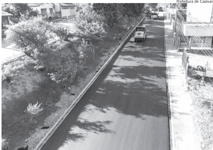
Diversas melhorias serão implantadas na avenida

to, a obra contemplará ainda a acessibilidade em calçadas, novos canteiros, colocação de iluminação em led,