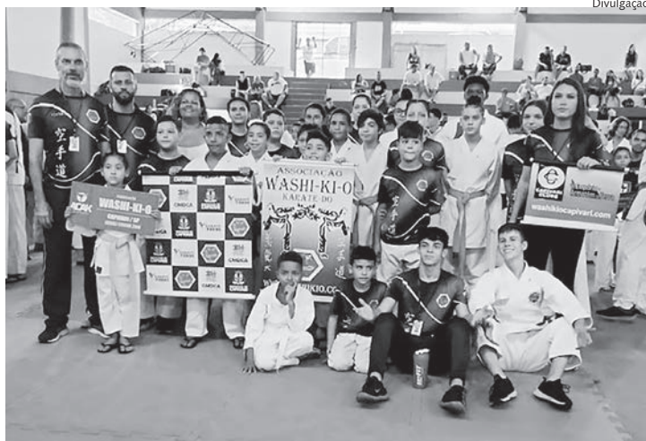
Equipe da Washi-Ki-O fez bonito e trouxe o 3º lugar no geral

Capivari esteve representada por 31 caratecas, sendo 13 deles do projeto Karate Para Todos do bairro São João Batista, Castelani e escola José Benedito. Na somatória geral dos pontos, a Washi-Ki-O conquistou