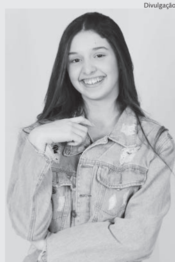
Atriz Isa Chiarion

Além de seu sucesso na TV, Isa também tem se destacado no cinema. No mês de abril, três cur-