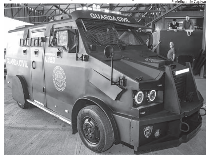
Blindado Arcanjo já está sob posse da Guarda Civil de Capivari

"Hoje é um dia histórico para nossa Guarda Municipal e a segurança pública da cidade. Com um