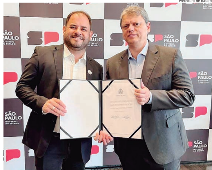
Prefeito Fabinho Santos e governador Tarcísio de Freitas

O prefeito de Rafard, Fabio Santos, anunciou a assinatura de um convênio com o Governo do Estado de São Paulo para a construção de casas populares destinadas às famílias afetadas por enchentes em áreas de risco. O convênio, no valor de R$ 6 milhões, foi firmado nesta sexta-feira, 26, em evento no Palácio dos Bandeirantes.