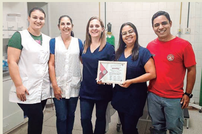
Equipe que realizou o atendimento e salvou bebê engasgado na Unidade Básica de Saúde de Rafard

A Moção de Congratulação 02/2024 destaca não apenas a ação rápida e eficiente dos profissionais de saúde, mas também a importância do trabalho desempenhado pela equipe da Unidade Básica da Saúde de Rafard no cuidado e atendimento 24 horas à população local.